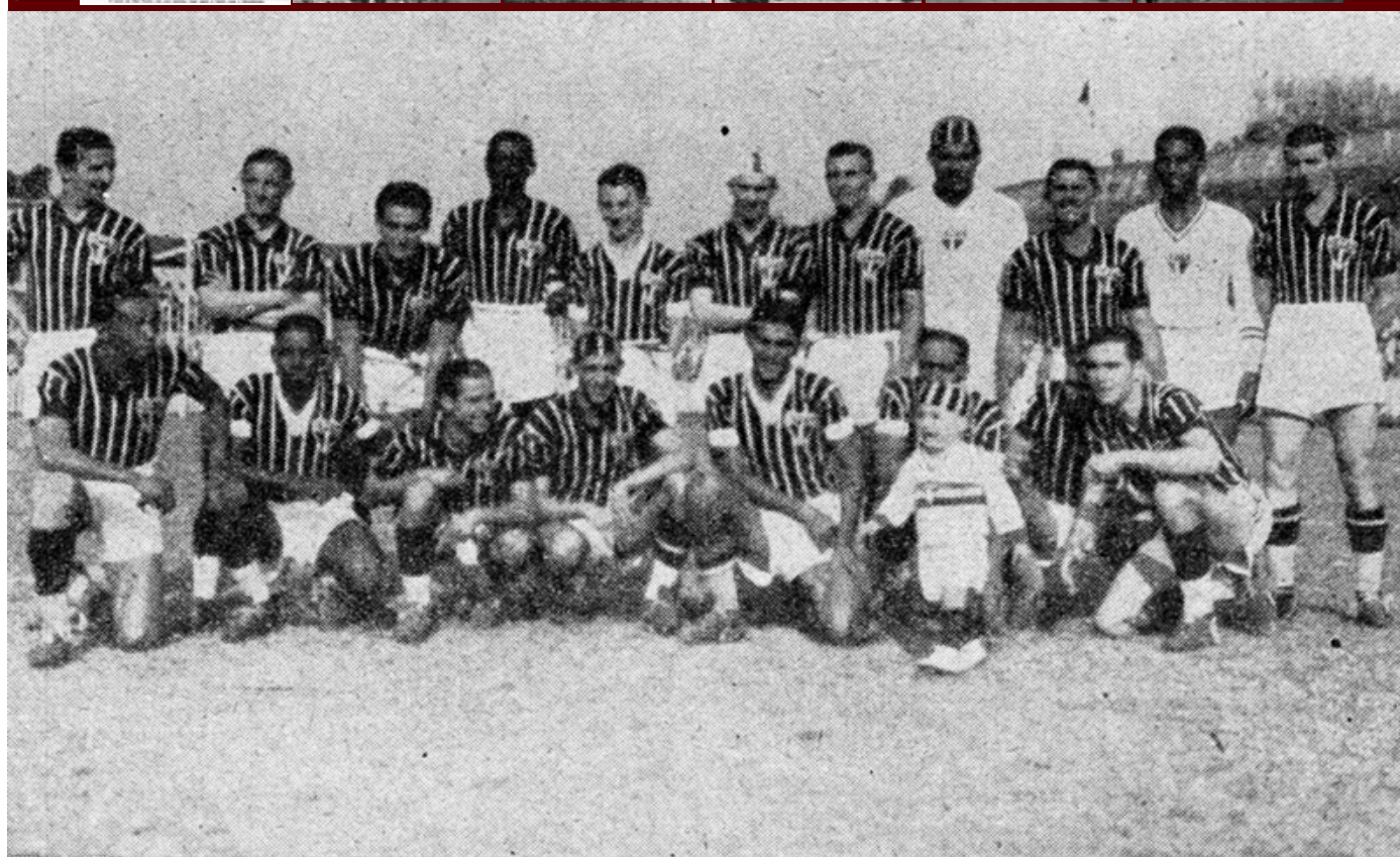
O team do São Paulo, em sua estréia, logo após a fusão com o Estudantes

FOTO 1 de 7 por Arquivo Histórico SPFC - 3 a 0 no Corinthians. O primeiro jogo com ex-jogadores do Estudantes