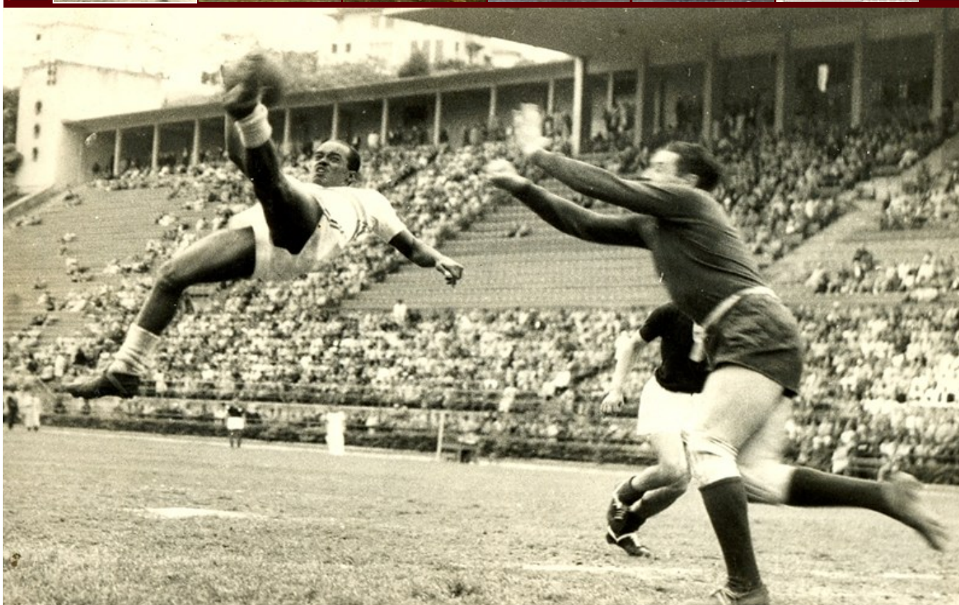
FOTO 1 de 25 - Bicicleta de Leônidas contra o Juventus

Leônidas da Silva foi um divisor de águas da história do São Paulo Futebol Clube. É bem verdade que o maior jogador da história do Brasil até surgir o próprio Leônidas havia jogado no mesmo São Paulo (Arthur Friedenreich), mas a chegada do Diamante Negro ao Tricolor transformou o clube, representou com o futebol e com as conquistas uma mudança de patamar, de paradigma.