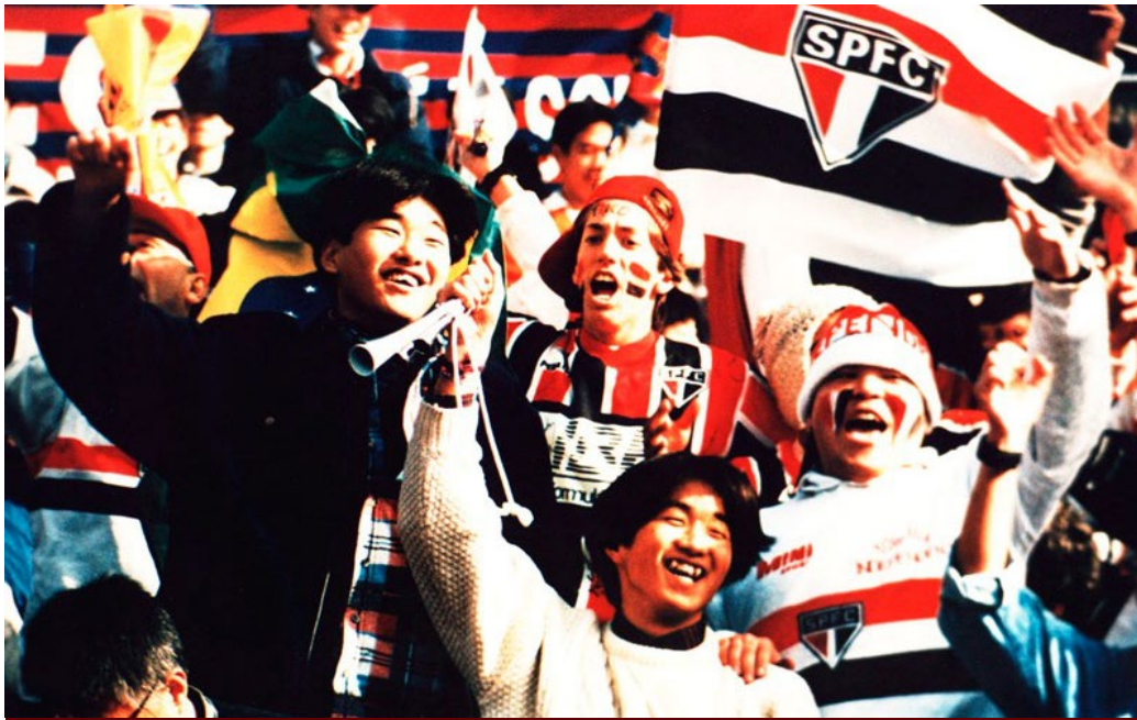
Torcida nipo-brasileira pelo Tricolor no Japão em 1992

Ao todo, foram 390* estádios, 263 cidades e 33 países visitados pela equipe principal do São Paulo, desde 1930. Veja detalhes desses e de outros números do Tricolor logo abaixo: