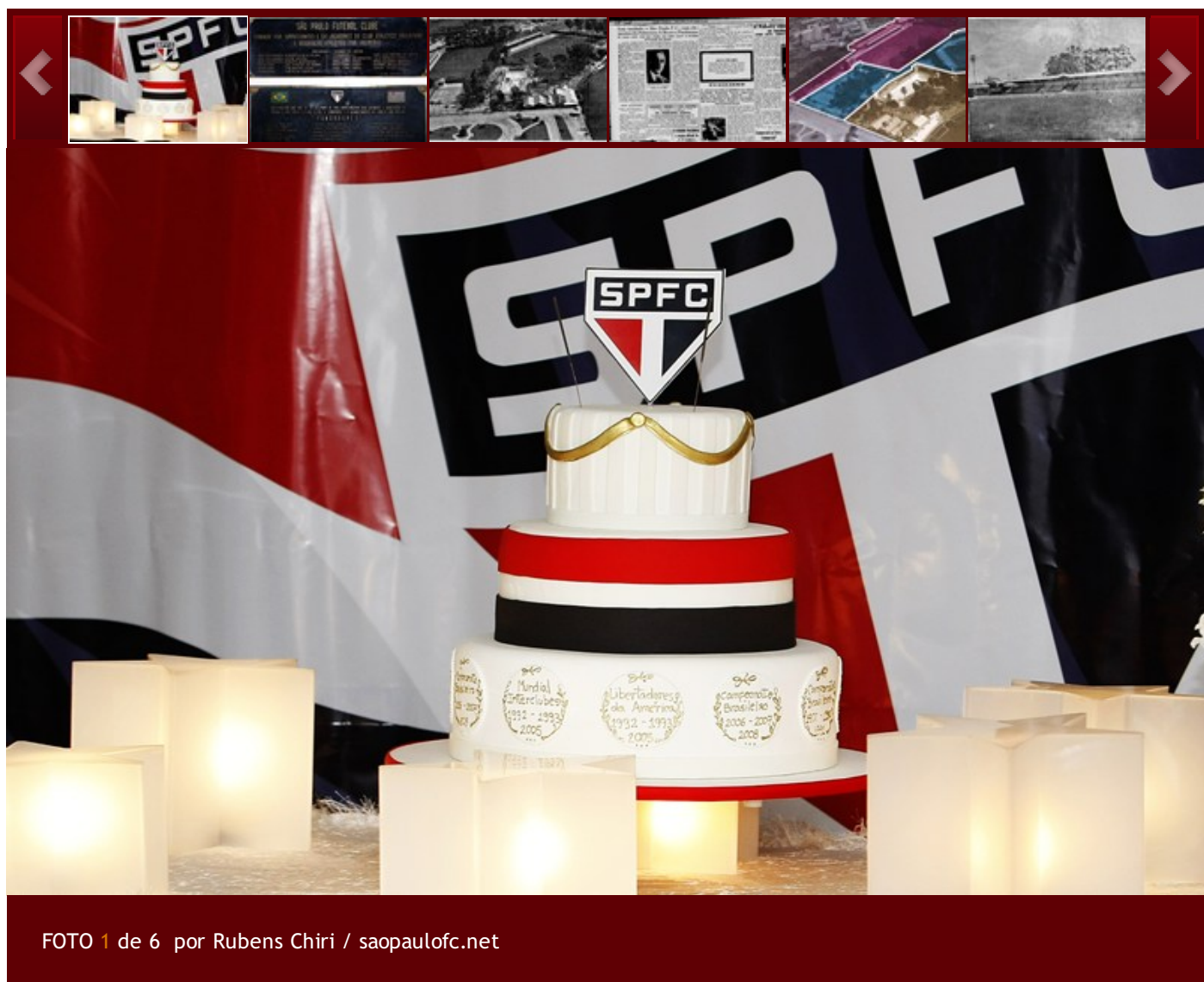
FOTO 1 de 6

Prosseguindo com o especial sobre a fundação do São Paulo Futebol Clube, apresentamos as reportagens de alguns jornais do período reportando a fundação do clube, também com a linguagem da época, para melhor ilustrar o contexto desse nascimento: