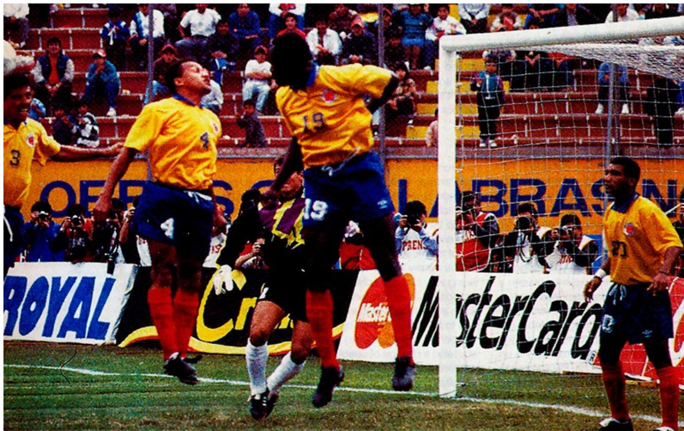
Por Revista da Conmebol - Imagem ilustrativa da Colômbia em cena nas Eliminatórias de 1993

Estimativas apontam que os torcedores são-paulinos são entre 16 e 18 milhões de pessoas em todo o Brasil. Um público maior que populações de muitos países. Não é estranho pensar, então, que o Tricolor tenha muita história contra Seleções Nacionais. Neste especial de Copa do Mundo selecionamos algumas passagens de jogos do clube contra países que, hoje, muito possuem em comum com o São Paulo.