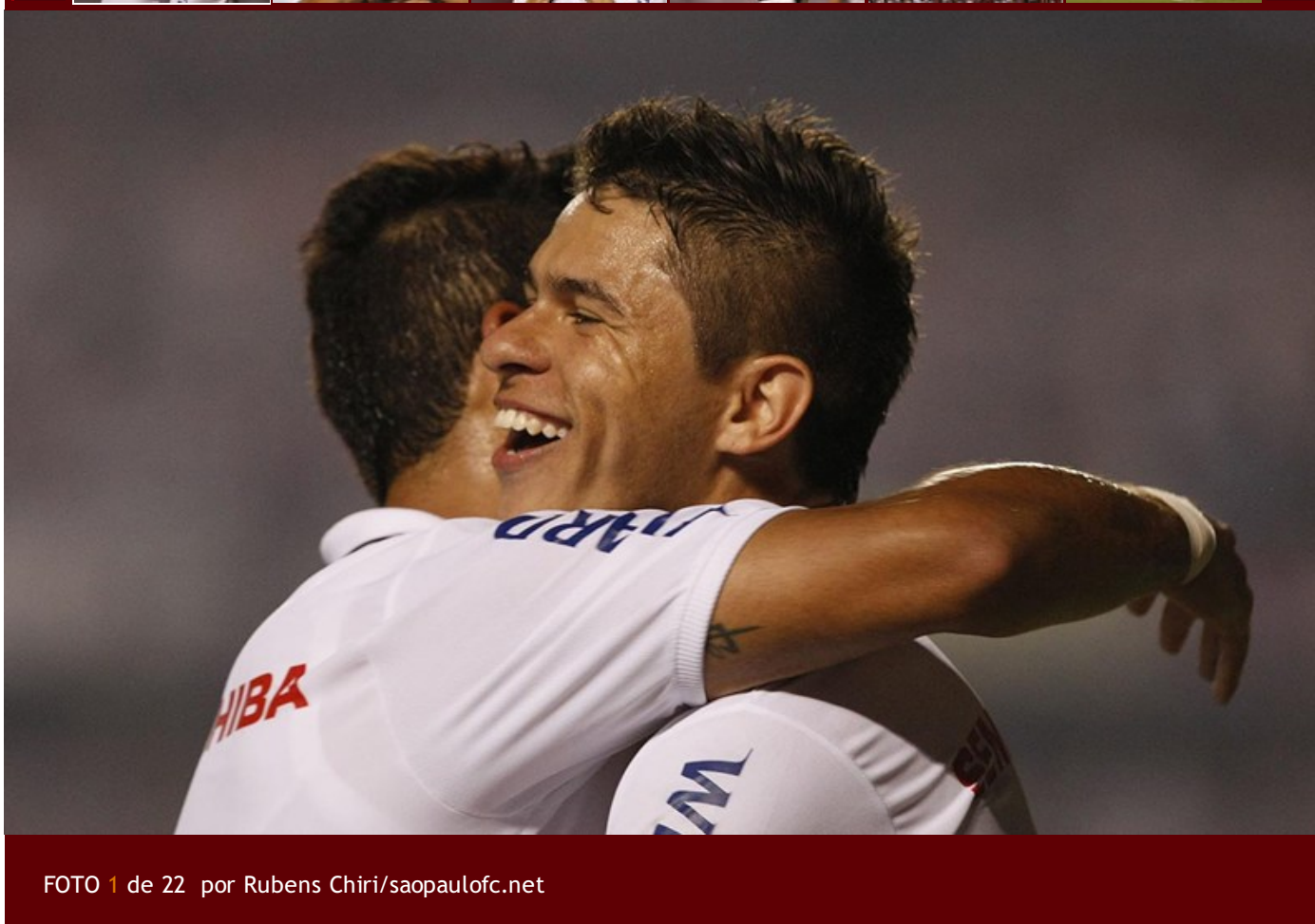
FOTO 1 de 22

Há três anos, no dia 12 de dezembro de 2012, os são-paulinos presentes no Morumbi presenciaram a conquista do 12º título internacional do Tricolor. Após a vitória por 2 a 0 sobre o Tigre, da Argentina (gols de Lucas e Osvaldo), e um abrupto final de jogo, com o time argentino desistindo da partida, o São Paulo comemorou o último título oficial da era Rogério Ceni. Também foi a despedida do jovem Lucas, que teve a honra, cedida pelo Capitão, de erguer o troféu de Campeão.