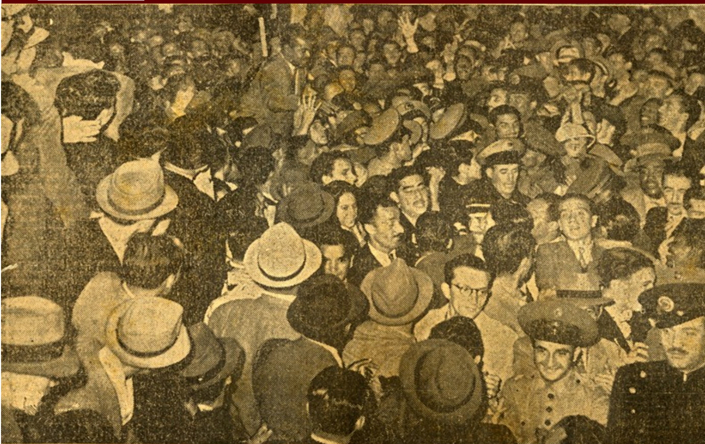
FOTO 1 de 22 por Arquivo Histórico do São Paulo Futebol Clube - Recepção a Leônidas, 1942

A recepção ao zagueiro uruguaio Lugano, no Aeroporto Internacional de Guarulhos, pelos torcedores tricolores na noite de ontem (12) pode ter espantado muita gente, mas não quem sabe o que é ser são-paulino de corpo e alma, muito menos aqueles que conhecem a história do São Paulo Futebol Clube.