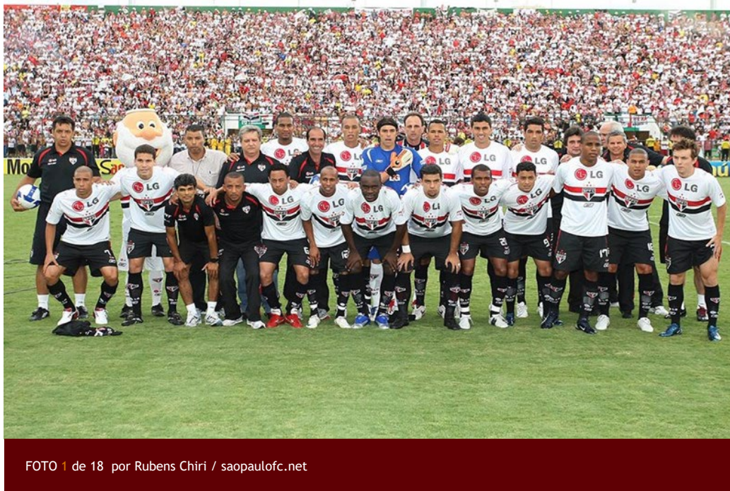
FOTO 1 de 18

O São Paulo Futebol Clube nunca havia sido tricampeão consecutivo em qualquer competição de futebol profissional até o inesquecível dia 7 de dezembro de 2008.