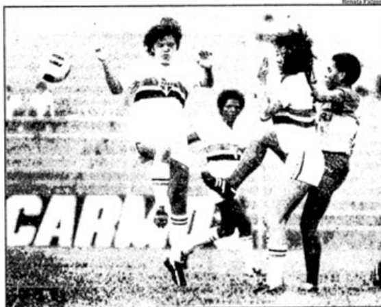
Craques do São Paulo e do Radar: não faltaram lances violentos