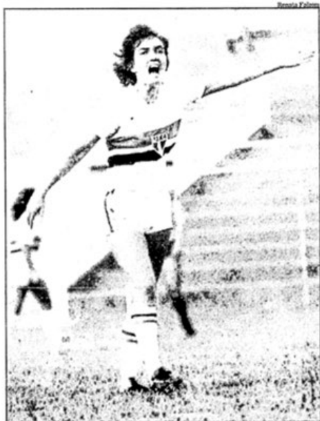
Marivora: palavrão de juiz foi demais e acabou indo para a súmula