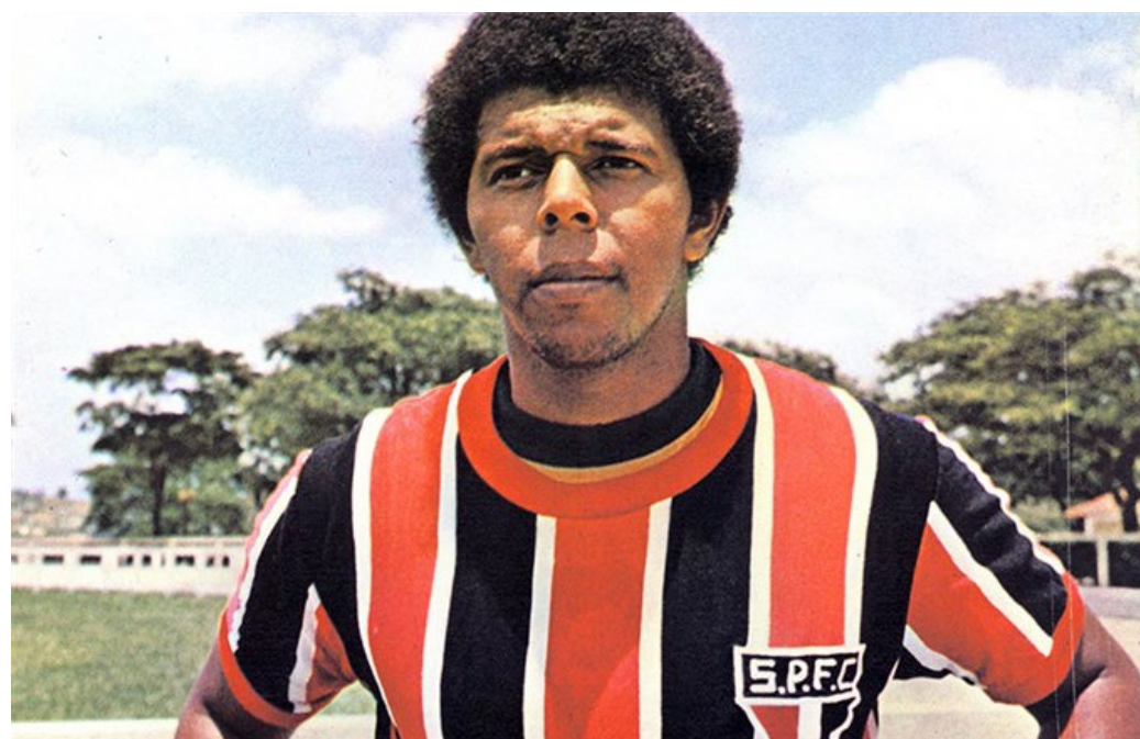
Mirandinha: em campo com a Seleção Brasileira na Copa do Mundo de 1974

Waldir Peres foi o primeiro goleiro tricolor a participar de uma Copa do Mundo. Não bastasse isso, disputou três consecutivas, 1974, 1978 e 1982. Mas na primeira edição em que tomou parte não entrou em campo em nenhum jogo, permanecendo no banco de reservas, com a camisa nº 22.