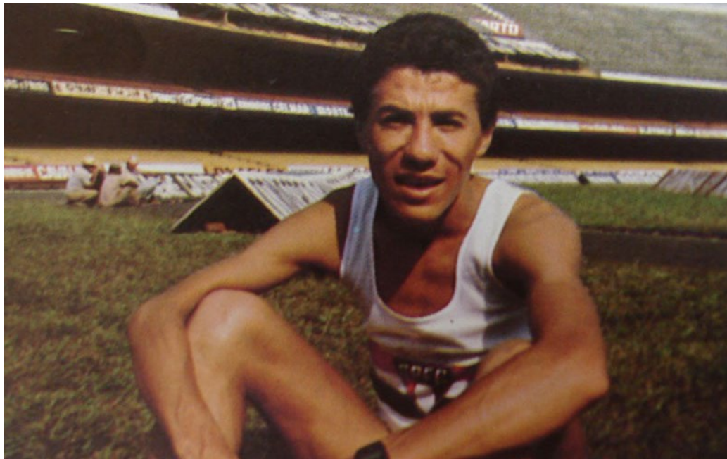
Por Arquivo Histórico do São Paulo FC

Como é notório, o São Paulo Futebol Clube possuiu um verdadeiro esquadrão no atletismo entre os anos 40 e os anos 60. Competidores de alto nível levaram o clube a um tetradecacampeonato seguido no Estadual - isso mesmo, 14 títulos - e um hexacampeonato no Troféu Brasil (sendo pentacampeão de forma consecutiva, tomando assim a posse definitiva daquele gigante troféu), e a centenas de outras competições nacionais e internacionais, culminando com a medalha de ouro nos Jogos Olímpicos de 1952, de Adhemar Ferreira da Silva e seus recordes mundiais no salto triplo, em 1952 e 1955 - nesse último, nos Jogos Pan-Americanos.