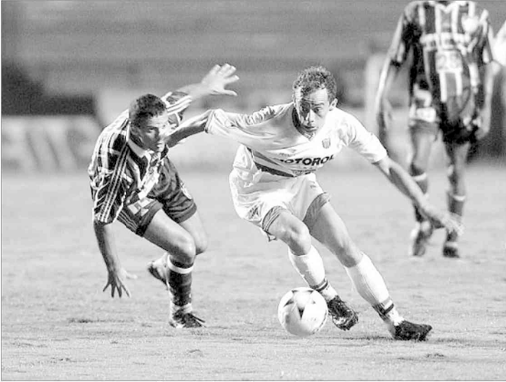
França aproveitou uma das poucas chances que teve para marcar; oportunidades surgiram apenas no segundo tempo, depois da entrada de Cacá e Carlos Miguel

(O Estado de S. Paulo de 15 de fevereiro de 2001. Foto: J.F. Diório/AE)