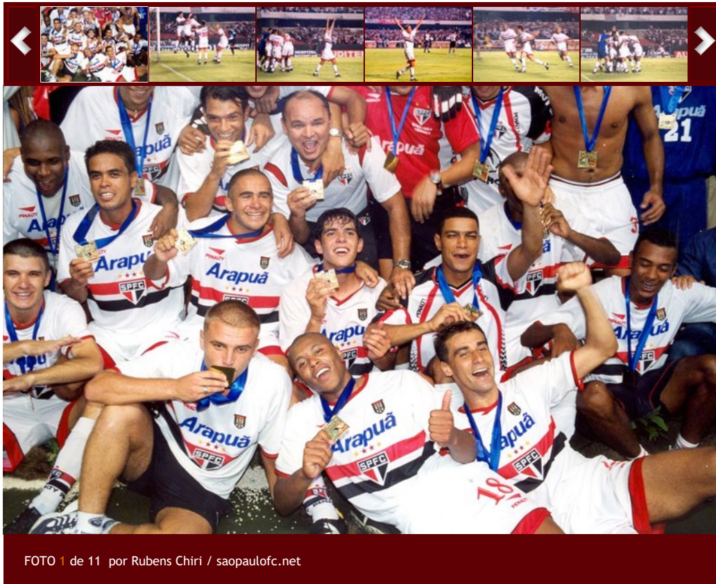
FOTO 1 de 11

Até o dia 7 de março de 2001, há 18 anos, o Torneio Rio-São Paulo era sinônimo de leve frustração para os são-paulinos. Em 21 participações, o máximo posto obtido fora o segundo lugar em quatro ocasiões (1933, a única edição nos anos trinta, 1962, 1965 e 1998 - em 2002 foi, novamente, vice-campeão). Mais do que o simples baixo desempenho - explicado pelo fato da competição ter existido, basicamente, durante o difícil período de construção do Estádio do Morumbi - tudo parecia acompanhado por altas doses de azar ou ironias do destino.