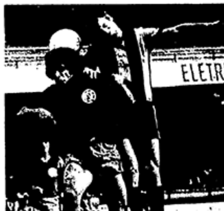
Peñarol e San Lorenzo: gols no fim

Local: Morumbi (preliminar de Corinthians e São Paulo). Juiz: Dulcídio Wanderlei Boschilia. Peñarol: Corbo; Mário Gonzales (Pires), Garisto, Peruena e Sories; Valter Garcia e Silva; Quevedo (Barbosa), Unanue, Morena e Galilea (Luize). San Lorenzo: Agostin; Glaria, Pires (Blandi), Maletto e Izamat; Telch (Pitarch), Chazareta e Cocco; Pinasco, Zélio (Bejtrán) e Mendonza.