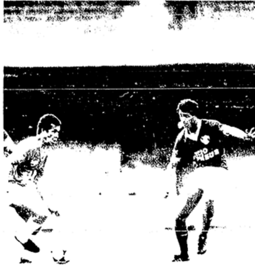
Um atacante do Mogi Mirim passa por dois adversários e parte para o goleiro