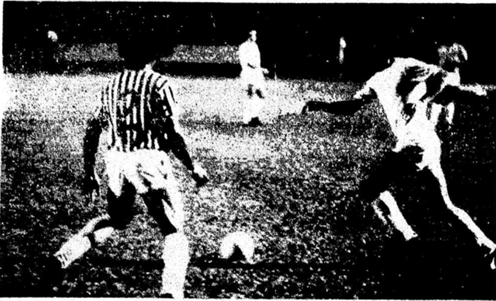
Cruyff não chegou a entusiasmar os 35 mil torcedores, mas fez o gol dos estrangeiros

Em 1976, o Fluminense tentava convencer o craque holandês Cruyff a jogar no Brasil. Para agradar o astro, ajudou a promover duas partidas amistosas com dois combinados de jogadores, um brasileiro e outro estrangeiro. A programação contava com churrascaria, rodas de samba, hotéis de primeira linha com tudo pago. Um alto investimento. O primeiro jogo foi no Morumbi, no dia 2 de junho, e o segundo no Maracanã, no dia 6 (vitória brasileira por 2 a 1). O clube carioca, contudo, viu o atleta desaproveitar a cidade carioca: "Se isto é o Rio quero voltar para Barcelona" ( disse ao Jornal do Brasil ) - Cruyff e esposa se espantaram com a Favela da Maré, ao lado do aeroporto do Galeão, e o cheiro que exalava do Gasômetro, em São Cristóvão, dentre outras picuinhas. No final das contas, o time carioca nem chegou a formalizar uma proposta.