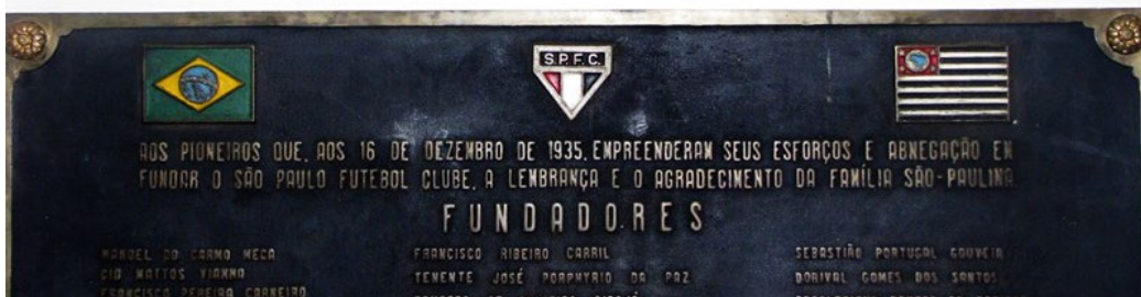
FOTO 1 de 14 por Arquivo Histórico do São Paulo Futebol Clube - A placa da fundação em 1930, atualmente no Memorial do São Paulo

O São Paulo Futebol Clube foi fundado em 25 de janeiro de 1930 e hoje comemora 89 anos de existência. O clube nasceu da união de dissidentes do Club Atlético Paulistano e da Associação Atlética das Palmeiras, tendo sua ata de fundação assinada na madrugada do dia 26 daquele mês devido ao tardar da reunião e à confecção dos estatutos.