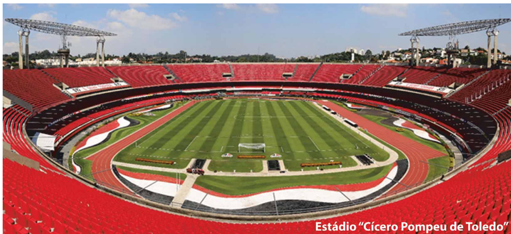
Estádio "Cícero Pompeu de Toledo"