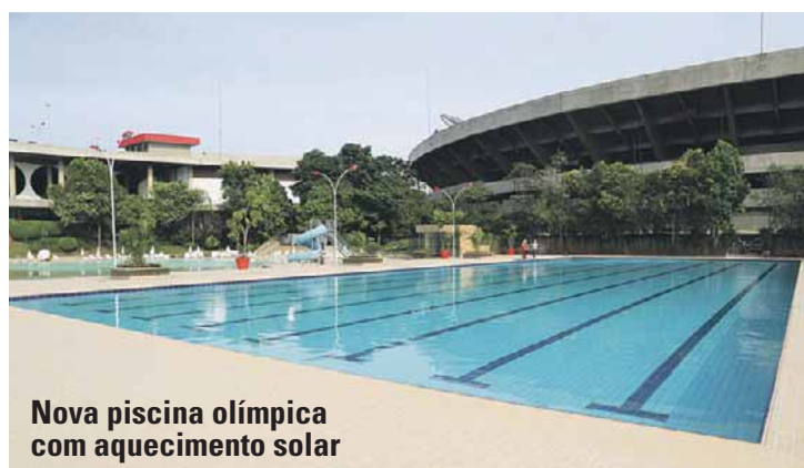
Nova piscina olímpica com aquecimento solar

O Parque Aquático ganhou uma nova piscina olímpica com aquecimento solar, novos deques, cascata e casa de máquinas.