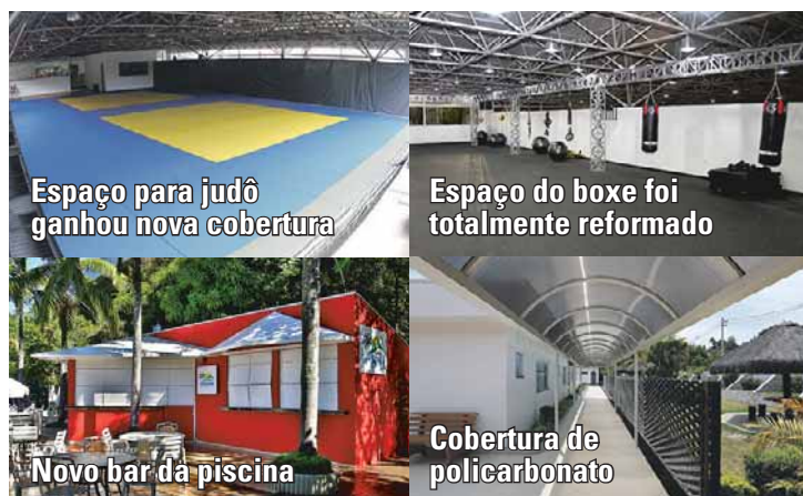
Espaço para judô ganhou nova cobertura

Foram reformados os ginásios e construído um conjunto de camarins para suporte nos eventos sociais, além da reforma do espaço destinado ao judô e boxe, com a instalação de nova cobertura.