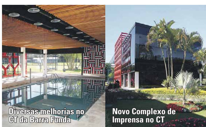
Diversas melhorias no CT da Barra Funda

Investimos R$ 21,4 milhões na manutenção e contratação de novos atletas para o elenco profissional de futebol, além de recontratar a comissão técnica responsável pela conquista do Tricampeonato Brasileiro consecutivo 2006, 2007 e 2008. Novos processos foram adotados de forma a retornarmos rapidamente a conquistar títulos e reviver nossas eras de glórias.