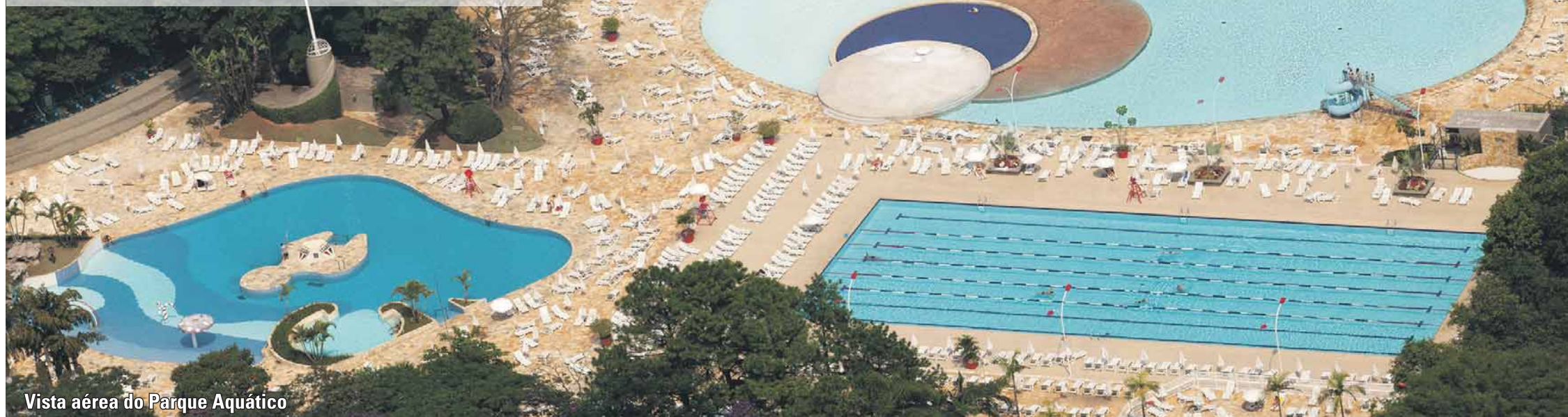
Vista aérea do Parque Aquático

2013 foi um ano de recuperação, melhorias e criação de novas receitas para o São Paulo FC