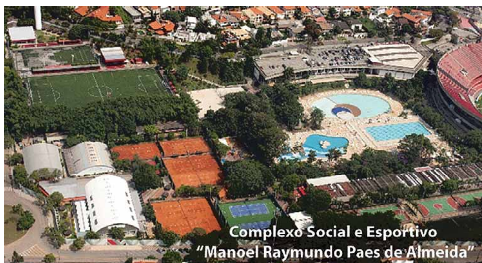
Complexo Social e Esportivo "Manoel Raimundo Paes de Almeida"