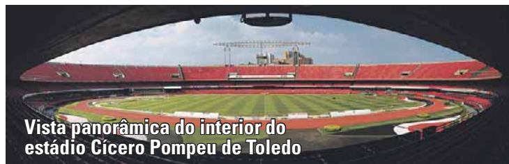
Vista panorâmica do interior do estádio Cícero Pompeu de Toledo

Em 2013, o Clube prosseguiu com os investimentos na modernização de seu patrimônio para atender as expectativas de seus torcedores, associados e parceiros comerciais.