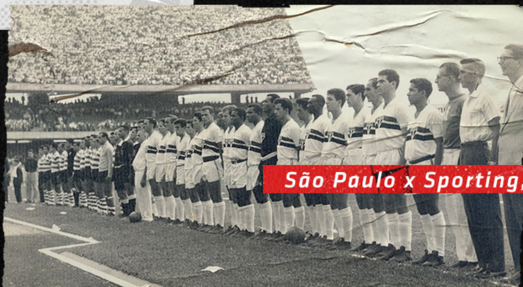
São Paulo x Sporting, 1960