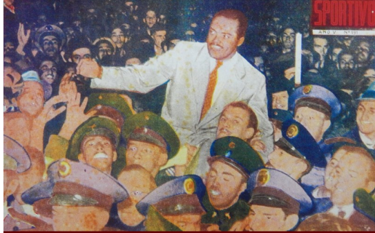
Por Globo Esportivo

10/04/2022 às 08:37