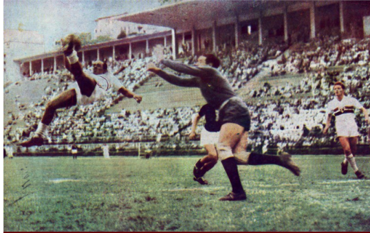
O gol de bicicleta eternizado por Leônidas da Silva

Michael Serra / Arquivo Histórico do São Paulo Futebol Clube - 03/06/2022 às 11:37