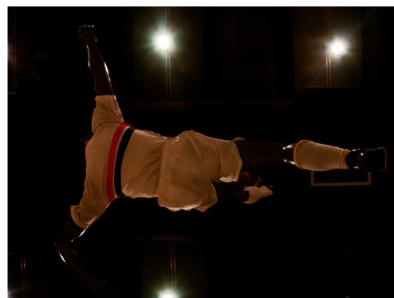
Estátua de Leônidas no Memorial do São Paulo Futebol Clube

Quanto aos dois restantes, nada consta, no momento. Contra o Ypiranga, em 1944, a dificuldade é por se tratar de um amistoso realizado em uma semana de clássico entre Palmeiras e Corinthians. Contra o Comercial, em 1949, nenhum material fotográfico do lance foi localizado. Mas quem sabe no futuro novas pesquisas não revelem cenas "inéditas".