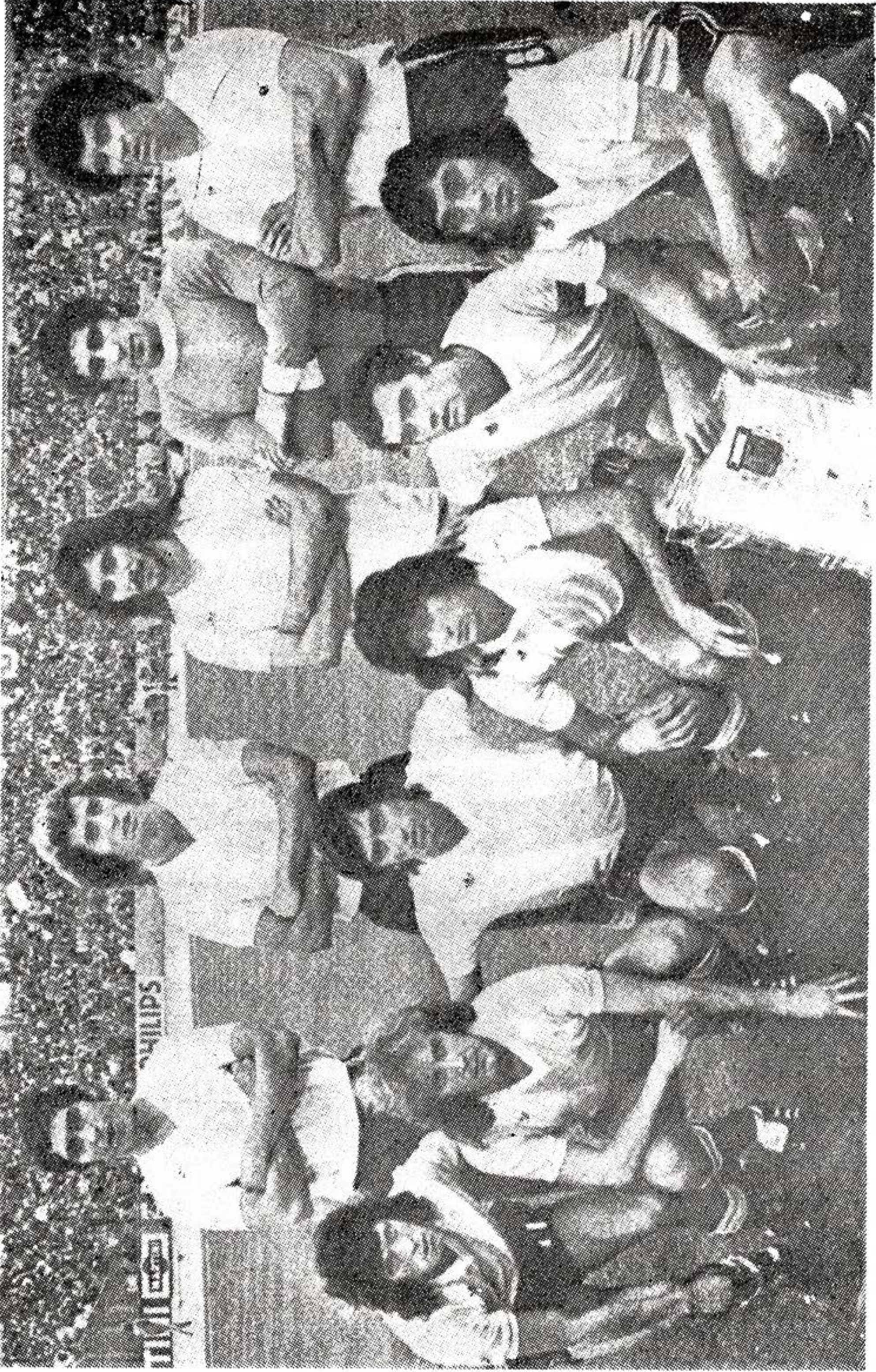
SELECCION DE ARGENTINA, participante Finales Copa Mundial de FIFA 1974.