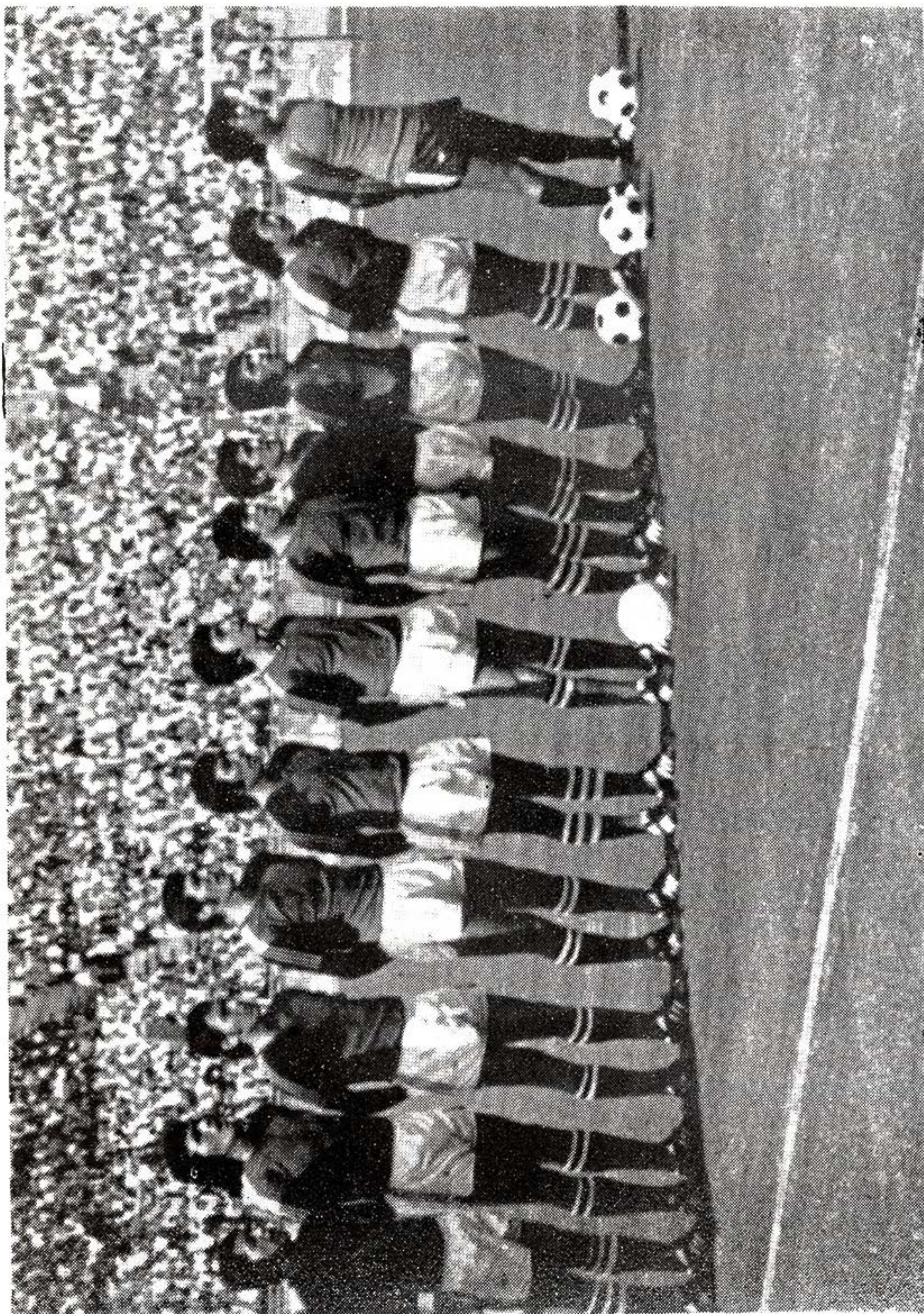
SELECCION DE CHILE, participante Finales Copa Mundial de FIFA 1974.