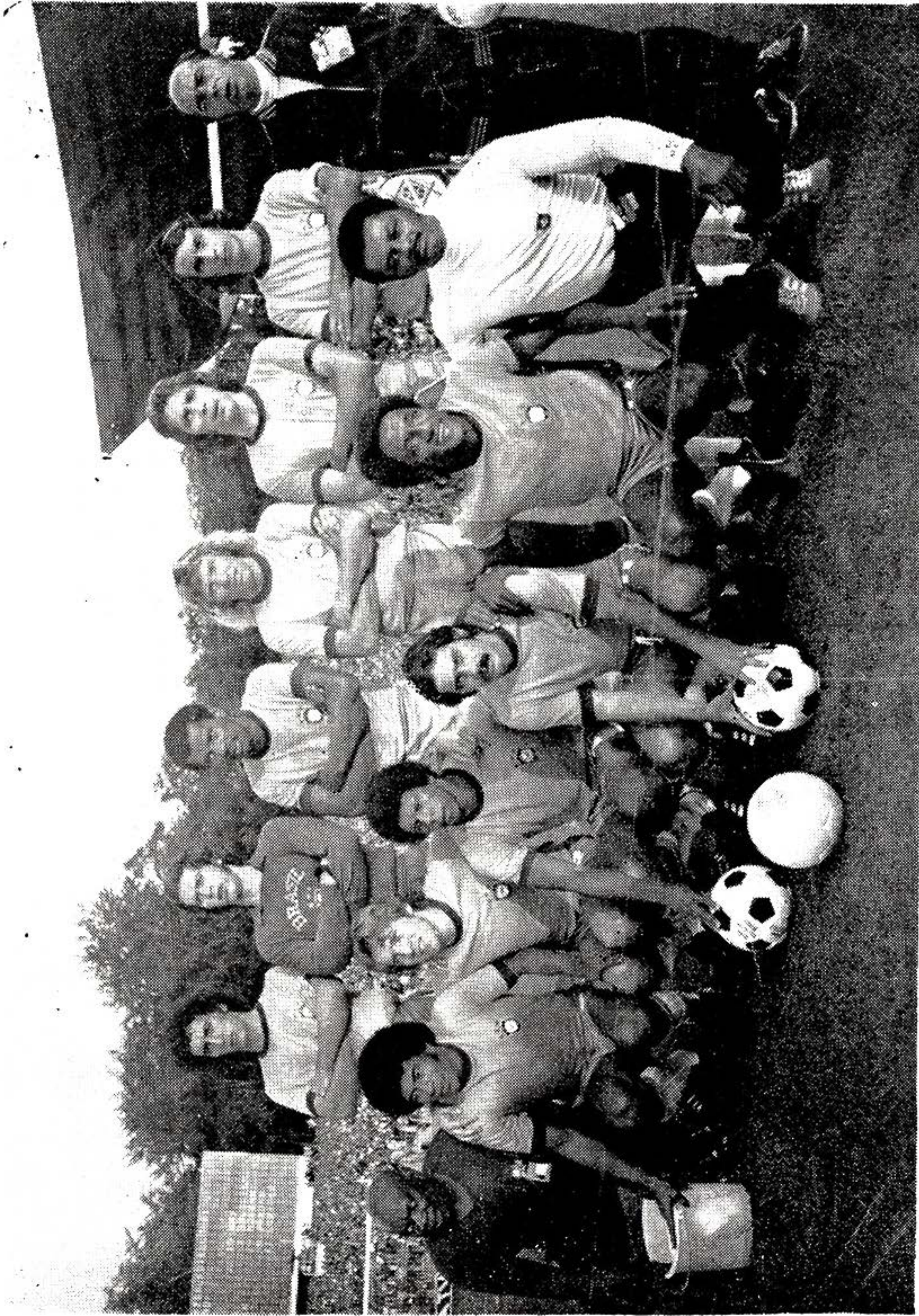
SELECCION DE BRASIL, participante Finales Copa Mundial de FIFA 1974.