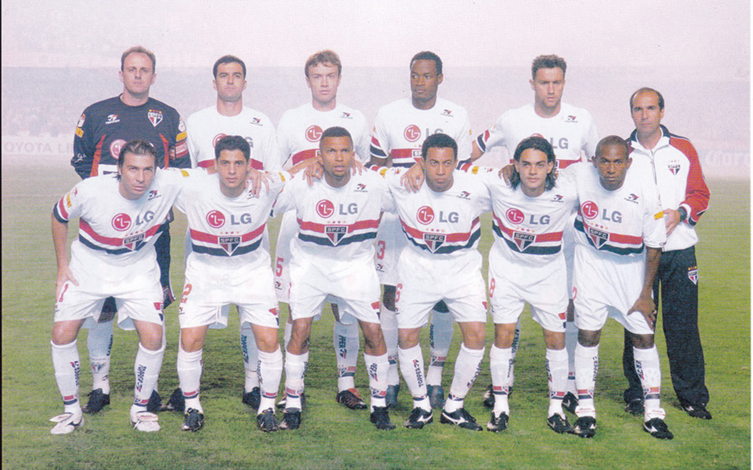
Los once que salieron a buscar la gloria. Arriba/ The eleven who went in search of glory. Standing: Rogério Ceni, Danilo, Lugano, Fabão, Alex. Abajo/ Kneeling: Luizão, Cichinho, Amoroso, Júnior, Josué, Mineiro.