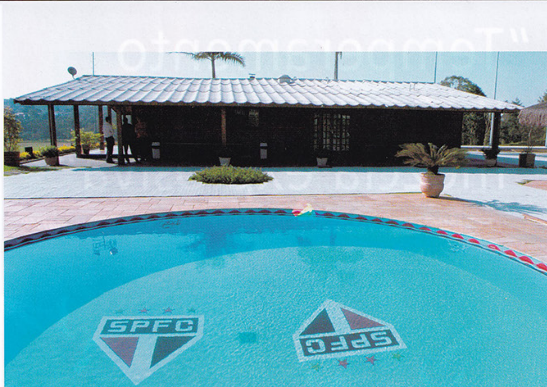
El nuevo Centro de Formación de Atletas del São Paulo FC en Cotia, municipio ubicado a 20 kms de la gran ciudad. Está destinado exclusivamente a las divisiones menores. En el futuro llegarán jóvenes de Estados Unidos, China, Japón y Corea a entrenarse con técnicos del club. São Paulo FC's new Athletes Formation Center in Cotia, town council located 20 km. from the big city. It is exclusively dedicated to junior divisions. Youngsters from the United States, China, Japan and Korea will arrive in the future to be trained by the club's coaches.

In addition to football, the centre has the necessary instalments for social meetings, as it is erected on a