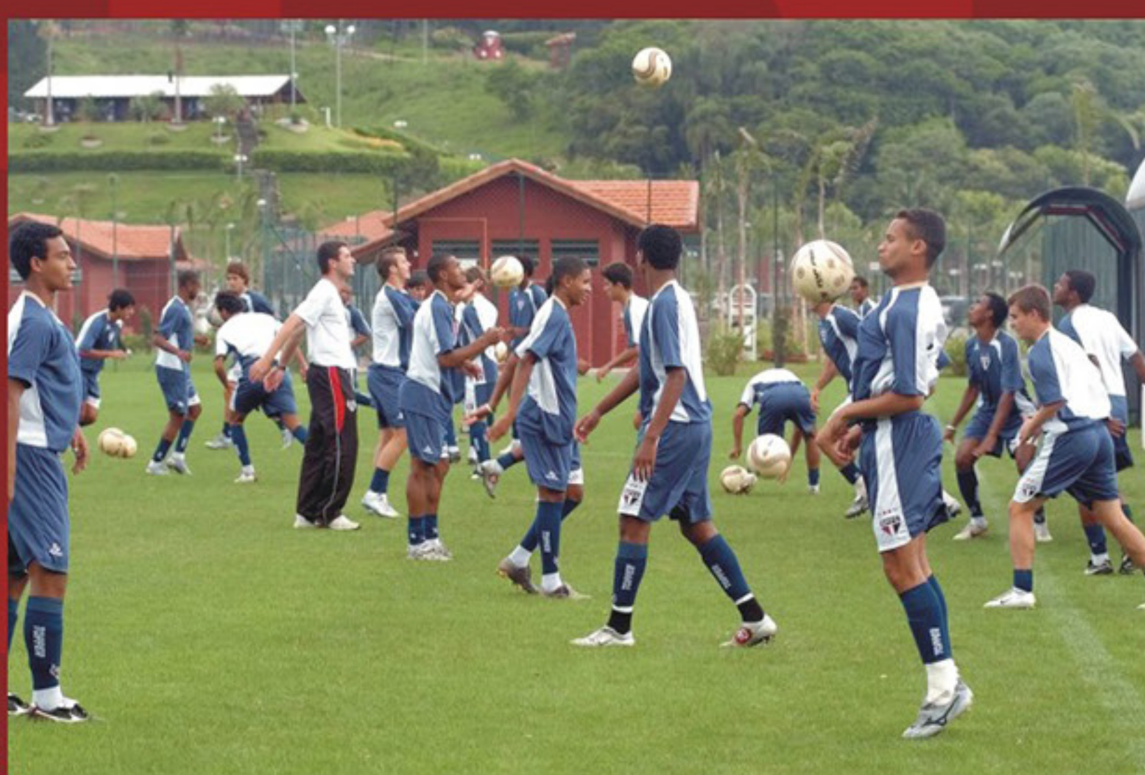
Vista panorâmica dos campos e alojamentos