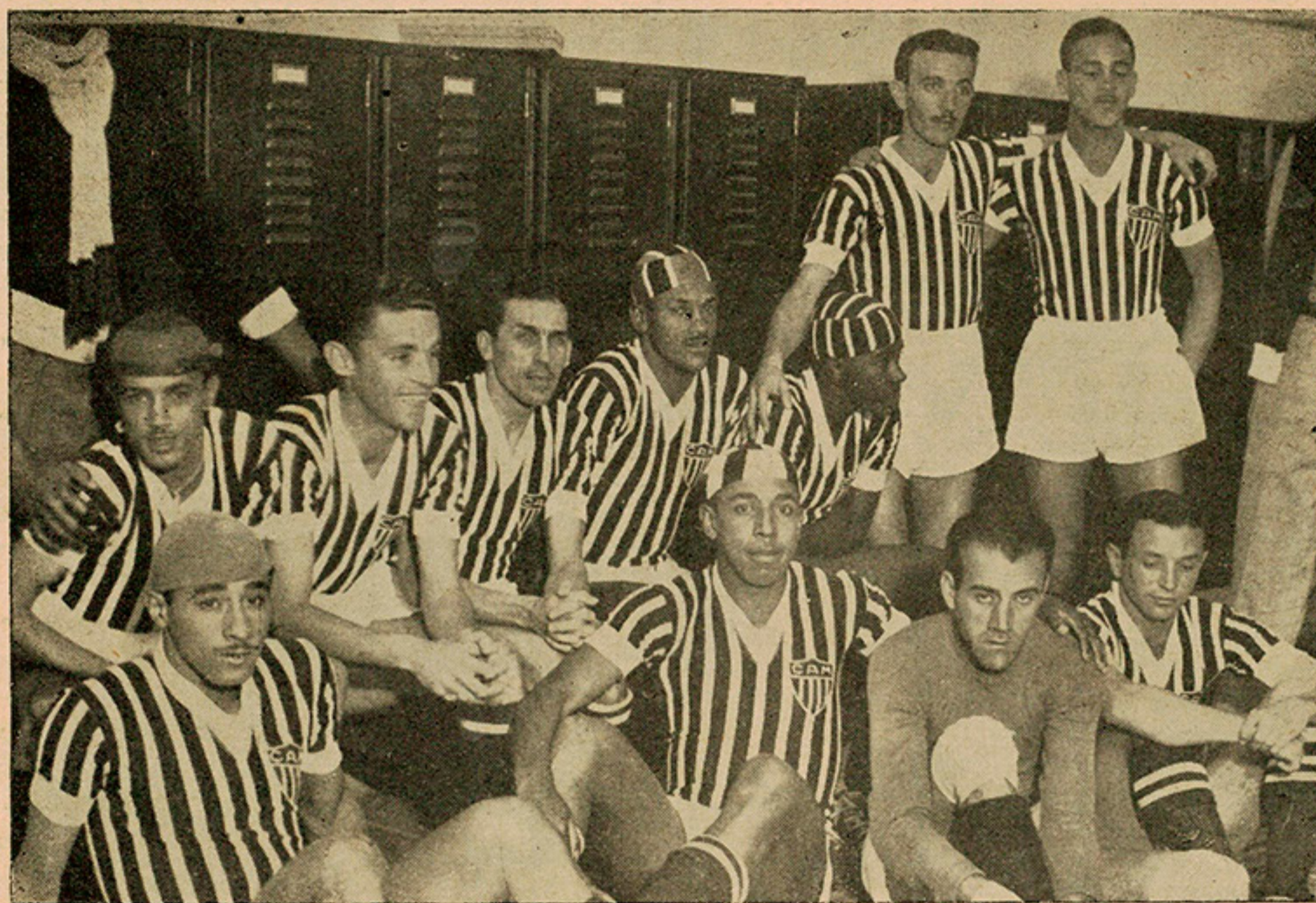
Quadro do C. A. Mineiro, vencido pelo S. Paulo pela contagem de 4 x 3.

com a colaboração do seu interessante extrema esquerda, talvez o valor lider do conjunto, como vimos nas duas partidas, o S. Paulo tenha ficado, quando no auge de sua vitória, sem o seu meia esquerda, um verdadeiro napoleãozinho do triunfo. Dos 7 goals — confirmando a abundancia de tentos nas partidas noturnas — poderíamos escrever muitas linhas elogiosas