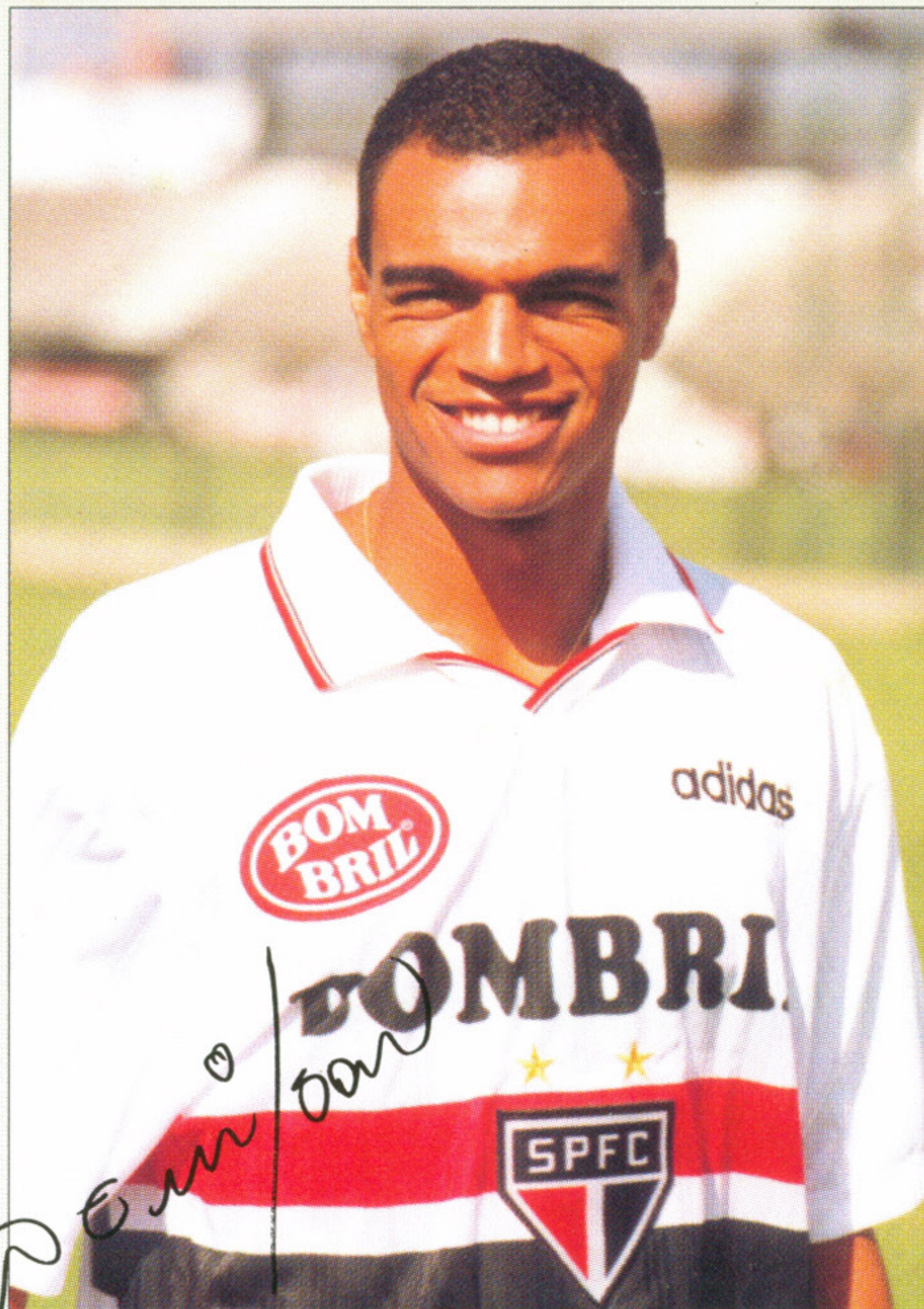
Denilson de Oliveira "Denilson"

1990 Campeão Gaúcho (Juvenil) 1991 Campeão Gaúcho (Júnior) 1993 Campeão Gaúcho (Profissional) 1994 Campeão da Copa do Brasil 1995 Campeão Gaúcho 1995 Campeão da Taça Libertadores da América 1996 Campeão Gaúcho 1996 Campeão da Recopa Sulamericana 1996 Campeão Brasileiro 1997 Campeão da Copa do Brasil