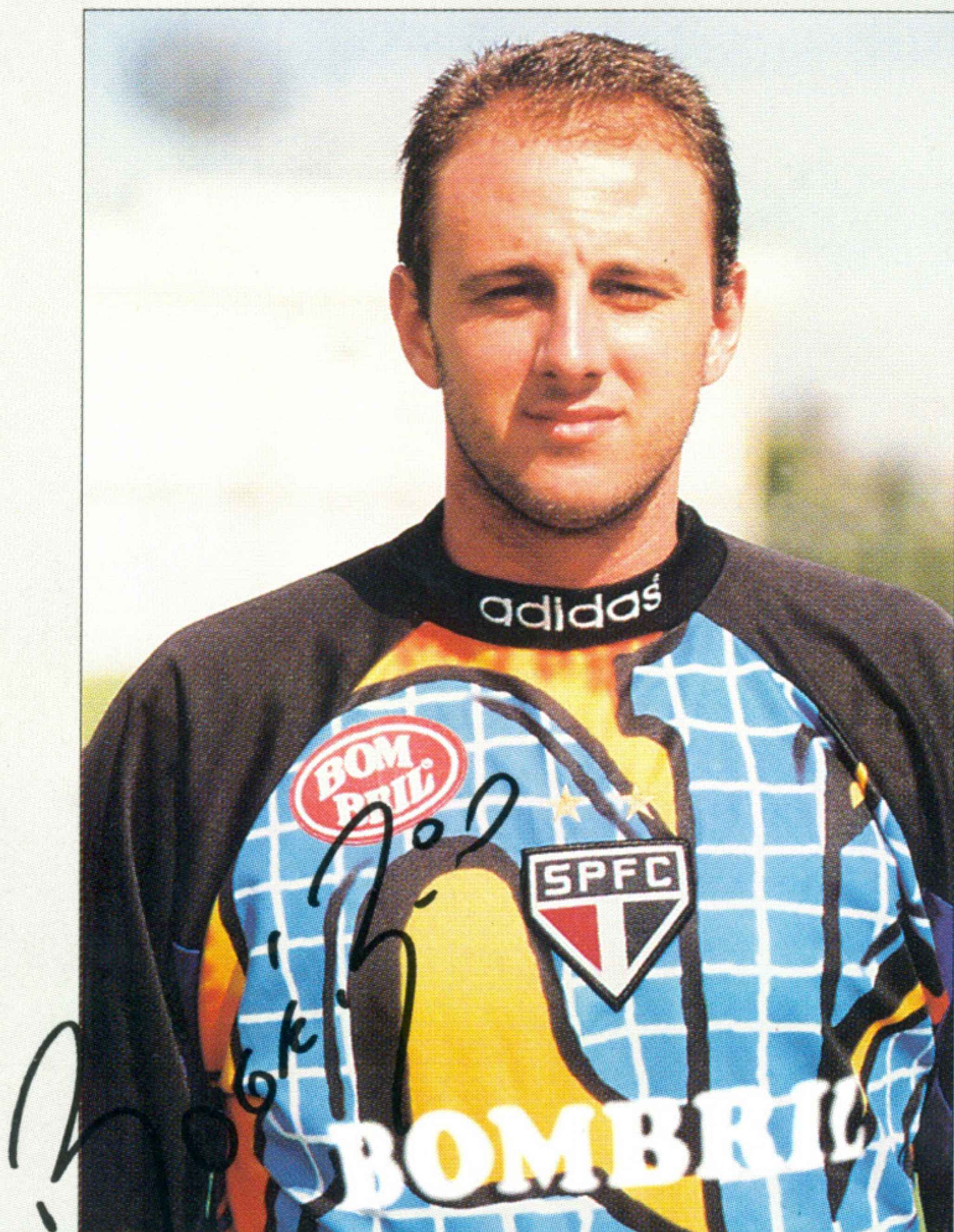
Rogério Ceni "Rogério"

Posição: Goleiro Altura: 1,88m Peso: 85 kg Chuteira: 41 Natural de Pato Branco-PR Data de nasc.: 22/01/73