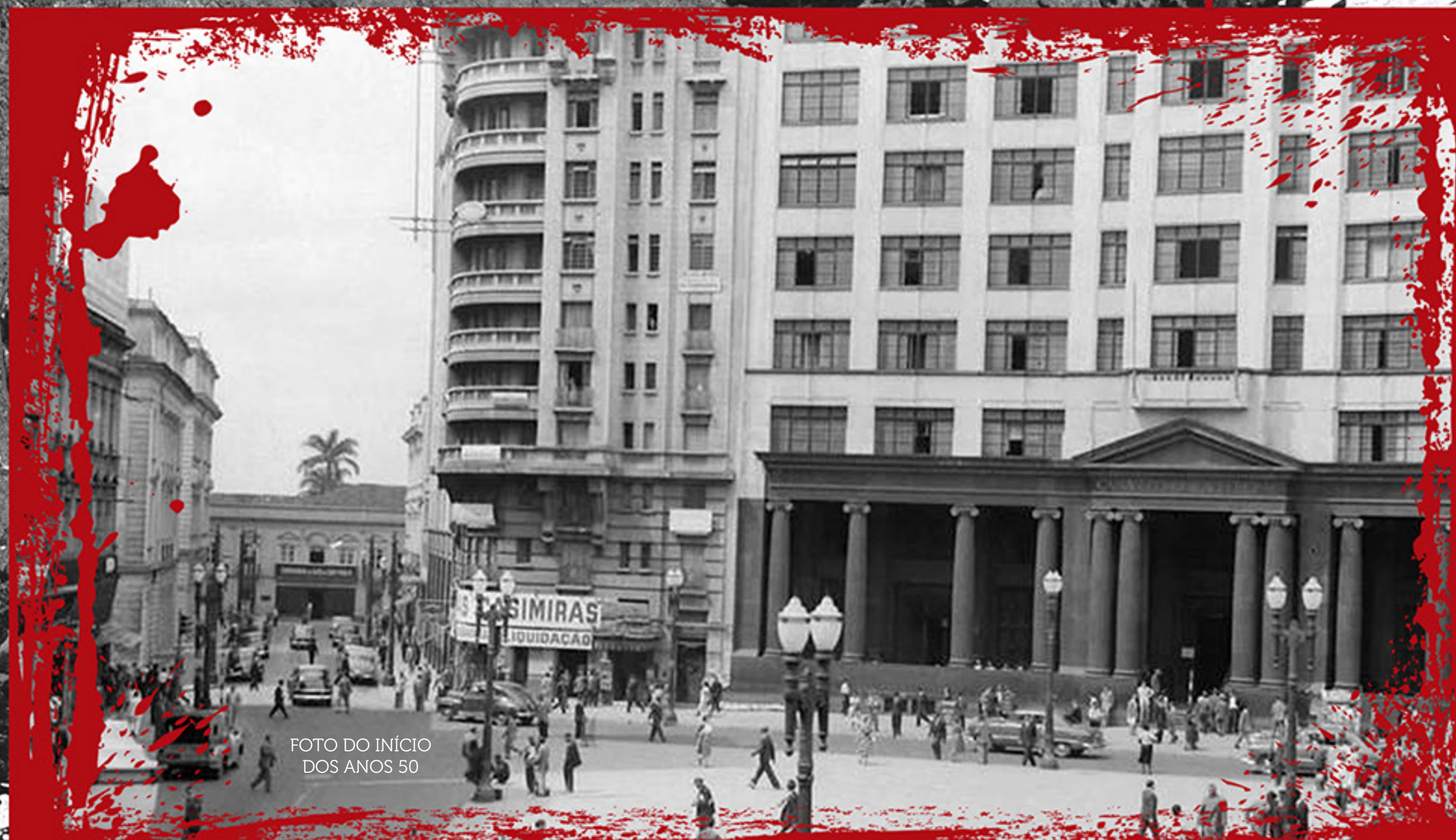
FOTO DO INÍCIO DOS ANOS 50