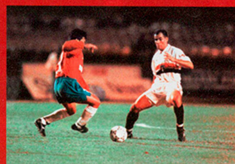
Dinho foi um cão de guarda no meio de campo