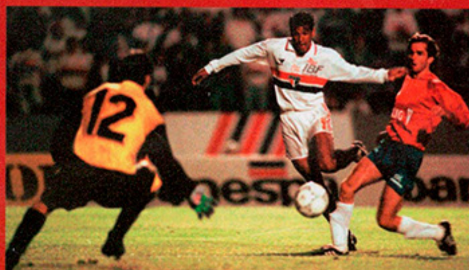
Müller se destacou mais uma vez como um ponta de velocidade