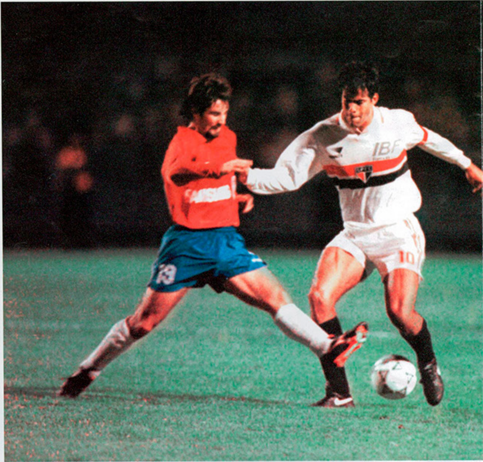
Rei do Morumbi Raí foi decisivo mais uma vez no Morumbi e marcou o quarto gol na goleada sobre o Universidad Caté

Raí despertou o interesse dos franceses do Paris Saint-Germain e deixou o São Paulo após a conquista da América. Foi o fim de uma era, mas o auge de um clube soberano!