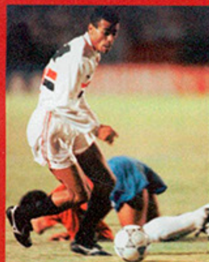
Cafu jogou em nova função

O mestre Telê Santana deslocou Cafu para o meio de campo. A zaga mudou inteira, incluindo os laterais. Dinho também ganhou a posição de volante.