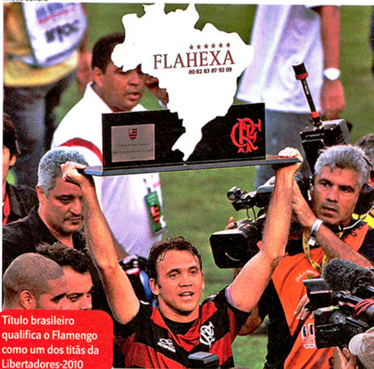
Título brasileiro qualifica o Flamengo como um dos titãs da Libertadores-2010