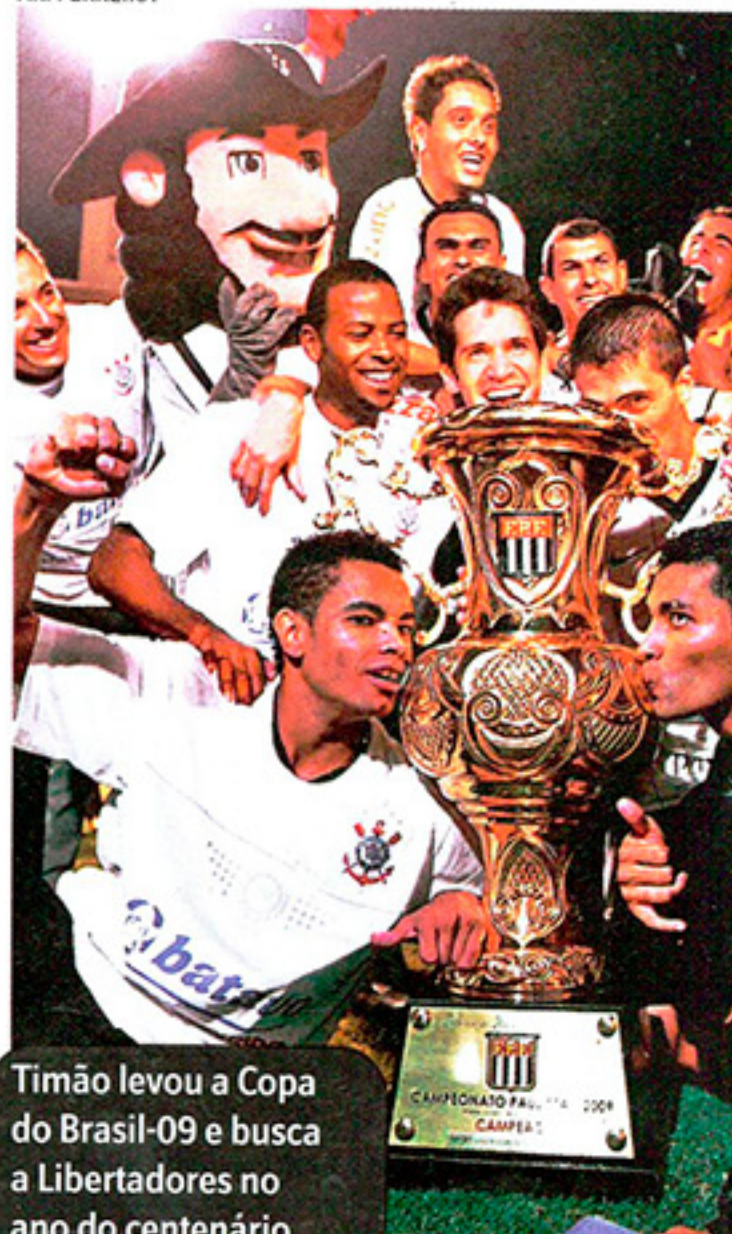
Timão levou a Copa do Brasil-09 e busca a Libertadores no ano do centenário