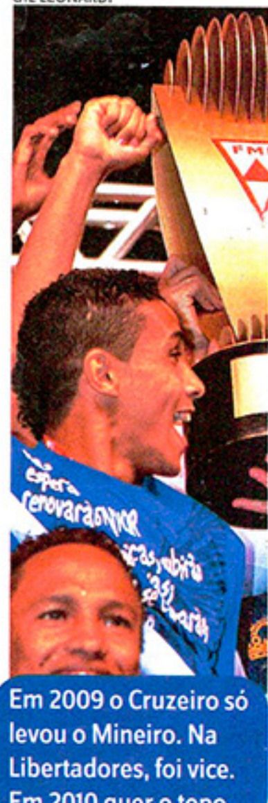
Em 2009 o Cruzeiro só levou o Mineiro. Na Libertadores, foi vice. Em 2010 quer o topo