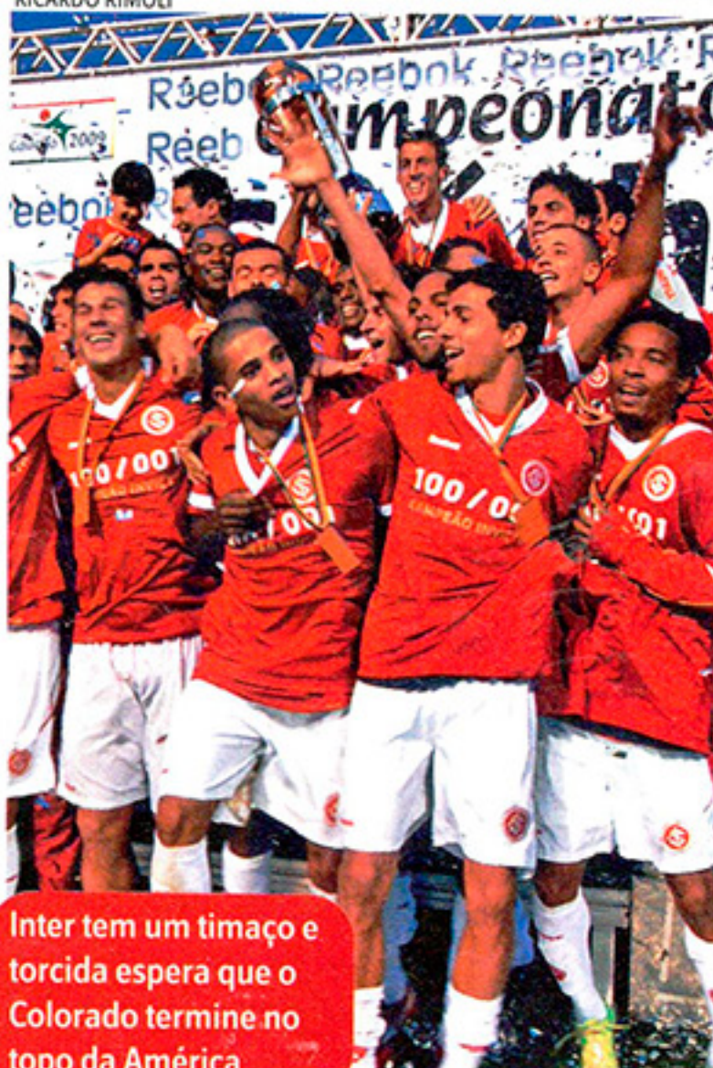
Inter tem um timaço e torcida espera que o Colorado termine no topo da América