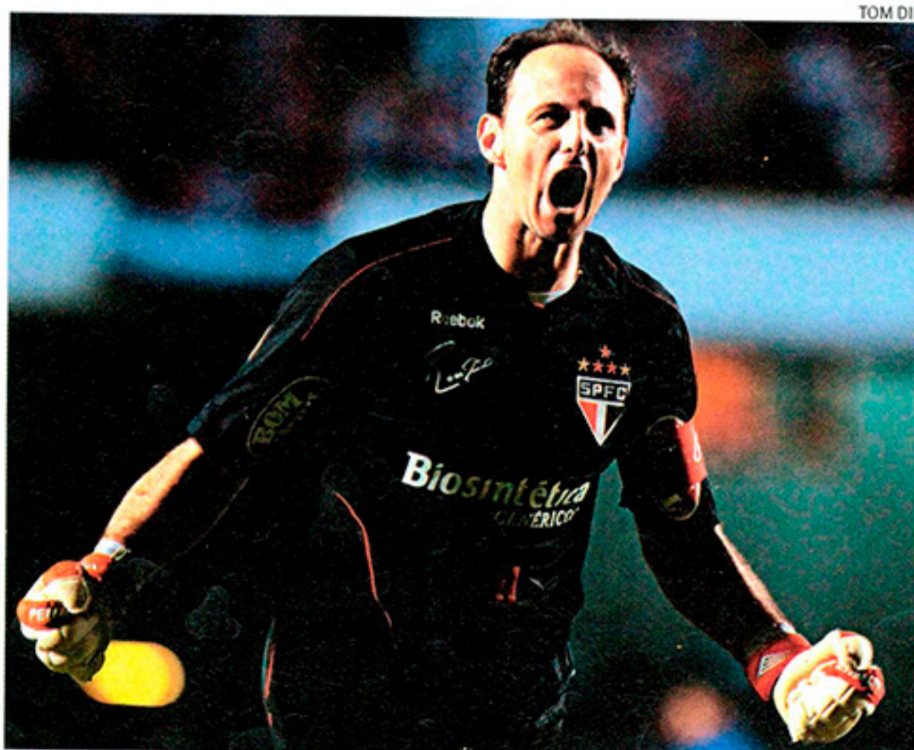
EU QUERO VER GOL Rogério Ceni é sempre esperança na defesa e no ataque