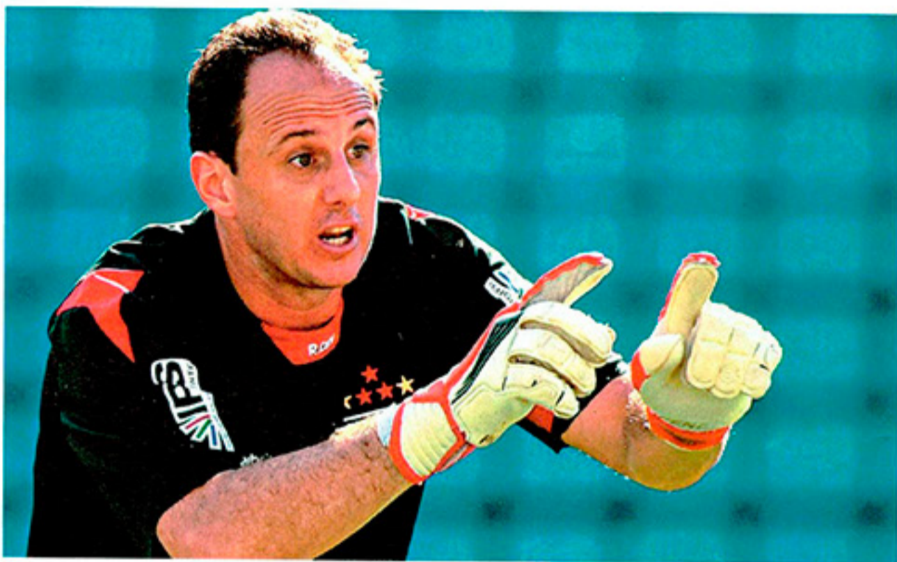
Ronaldo (acima) e Rogério Ceni são astros veteranos que brilham na disputa