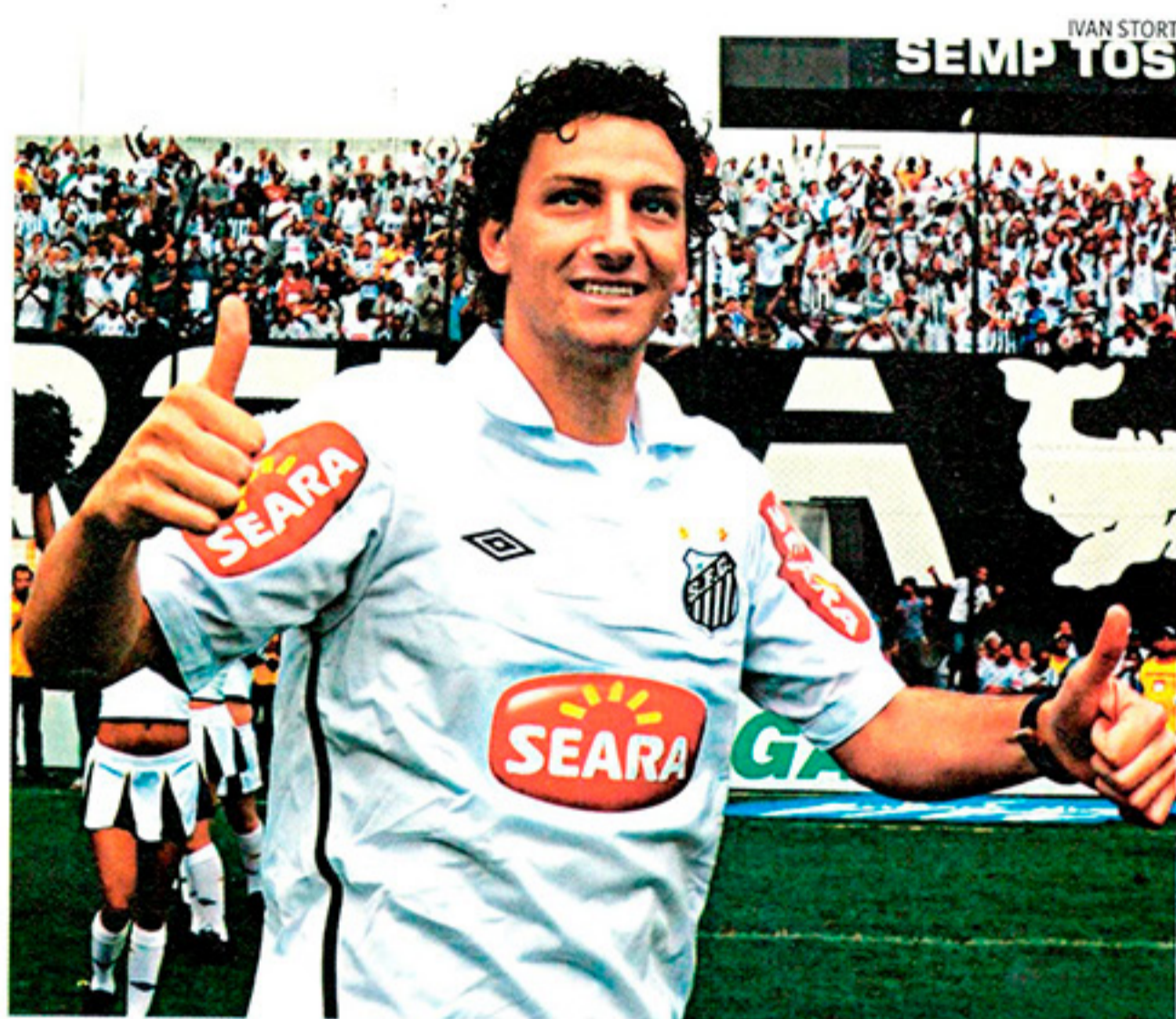
BOAS NOVAS Um dos raros destaques do Brasil na Copa 2010, Elano está de volta

Rivaldo, meia das Copas de 1998 e 2002, é outra estrela. Aos 38 anos, não só joga como preside o Mogi Mirim.