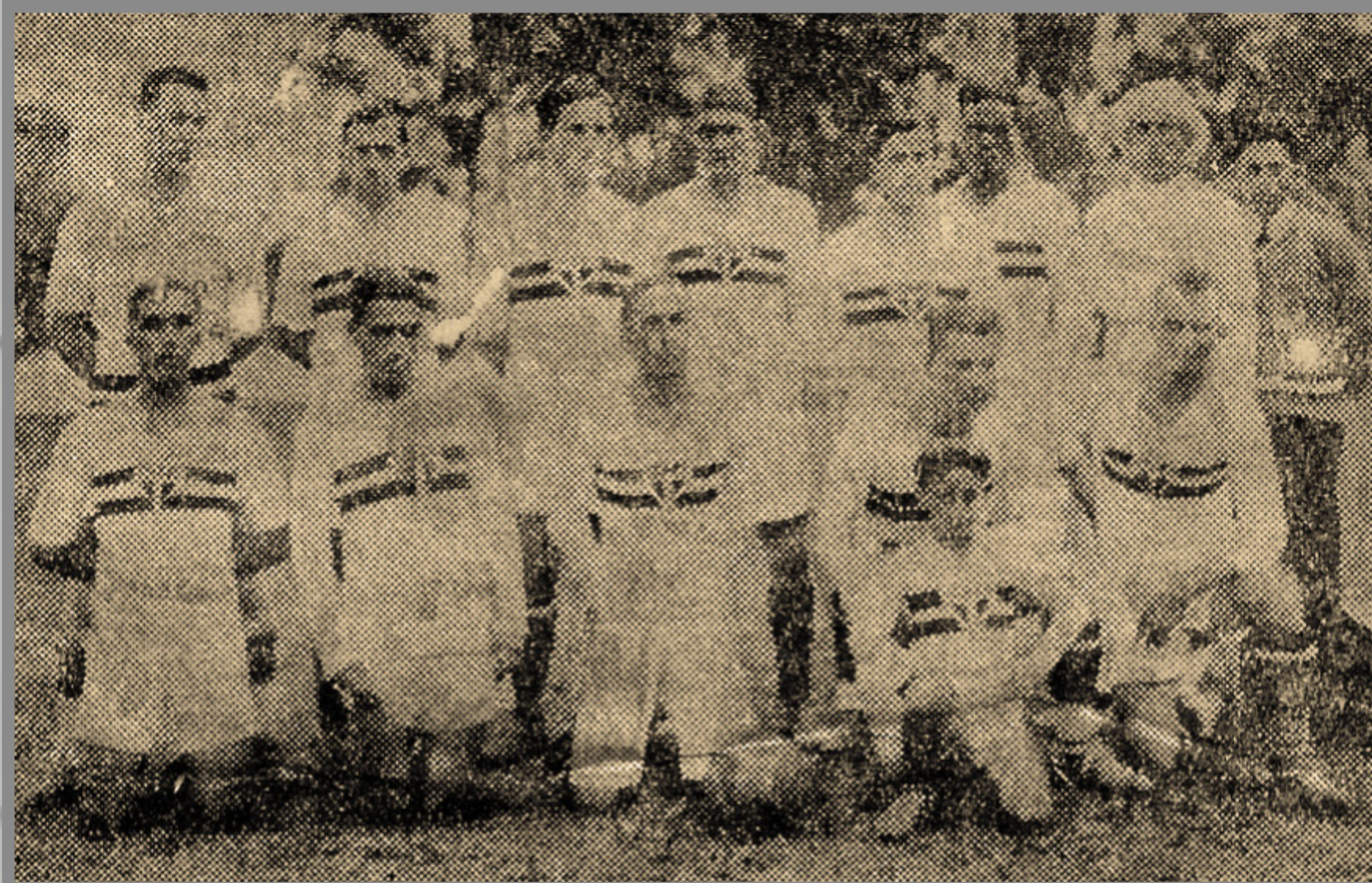
IMAGEM DE CORREIO PAULISTANO