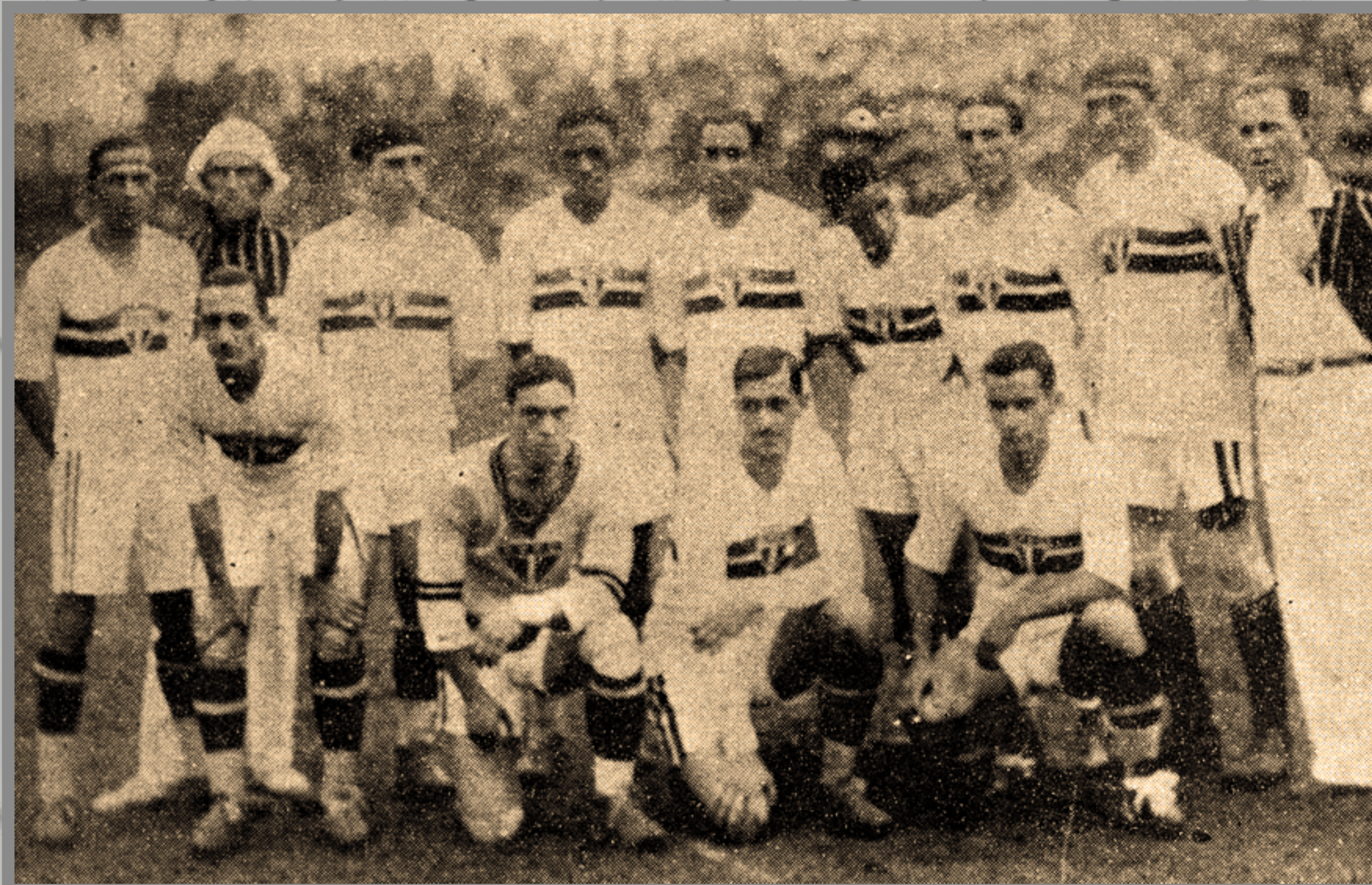
IMAGEM DE O TRICOLOR

CAMPEONATO PAULISTA ESTÁDIO DA CHÁCARA DA FLORESTA 25/OUT