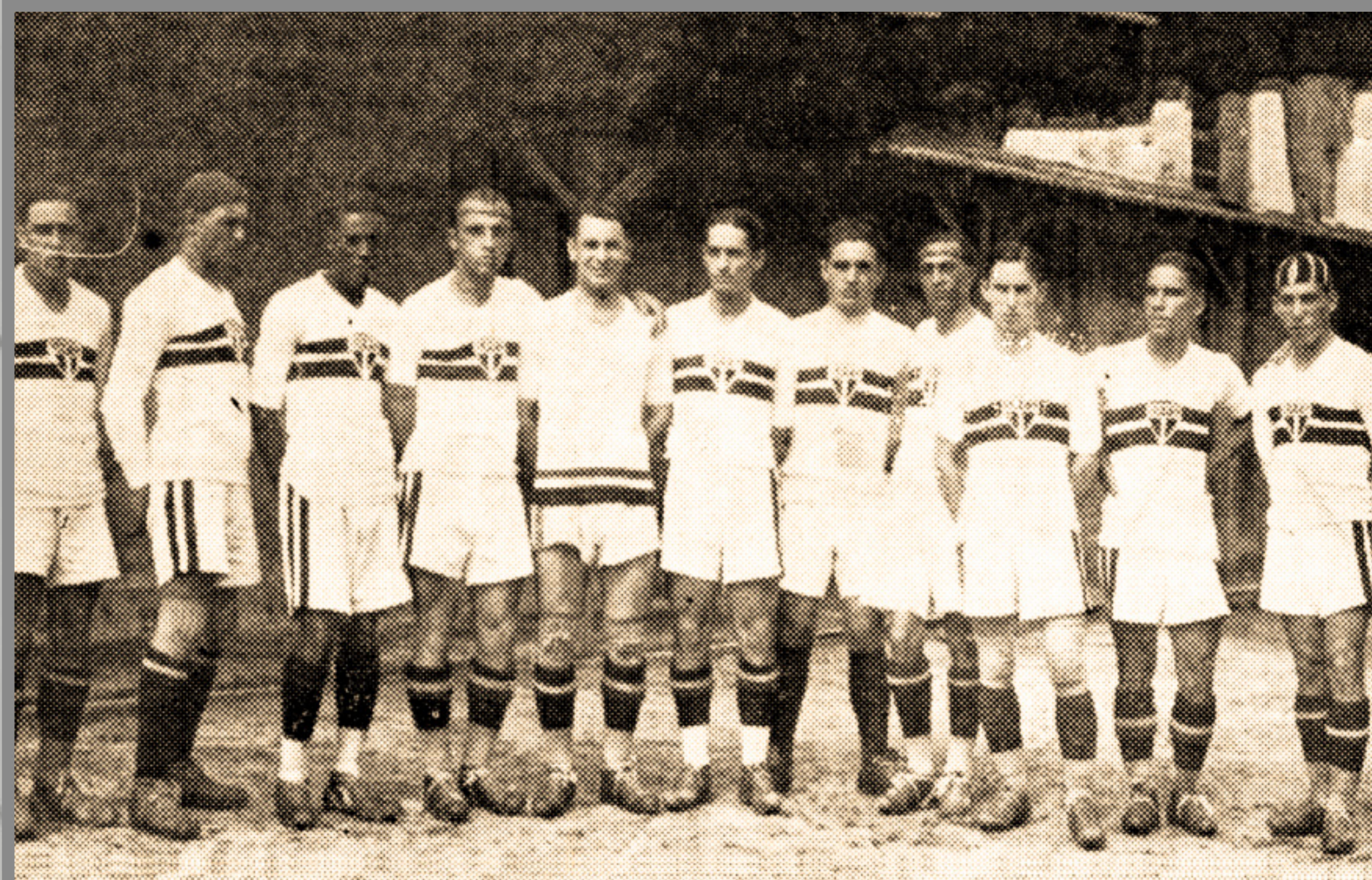
IMAGEM DE ARQUIVO HISTÓRICO

AMISTOSO NACIONAL ESTÁDIO DA CHÁCARA DA FLORESTA 14/MAR