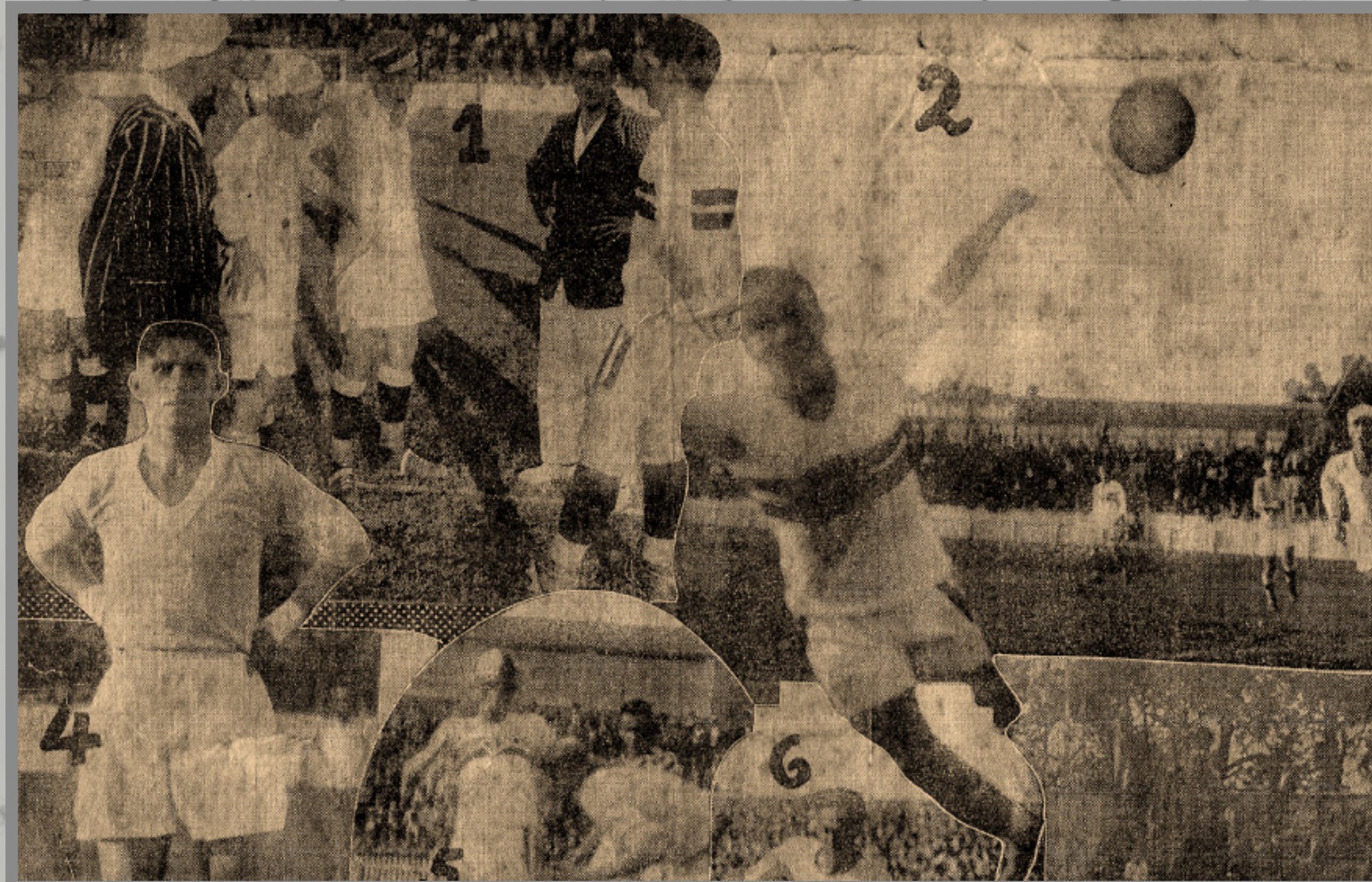
IMAGEM DE ARQUIVO HISTÓRICO

CAMPEONATO PAULISTA ESTÁDIO DA CHÁCARA DA FLORESTA 24/MAI