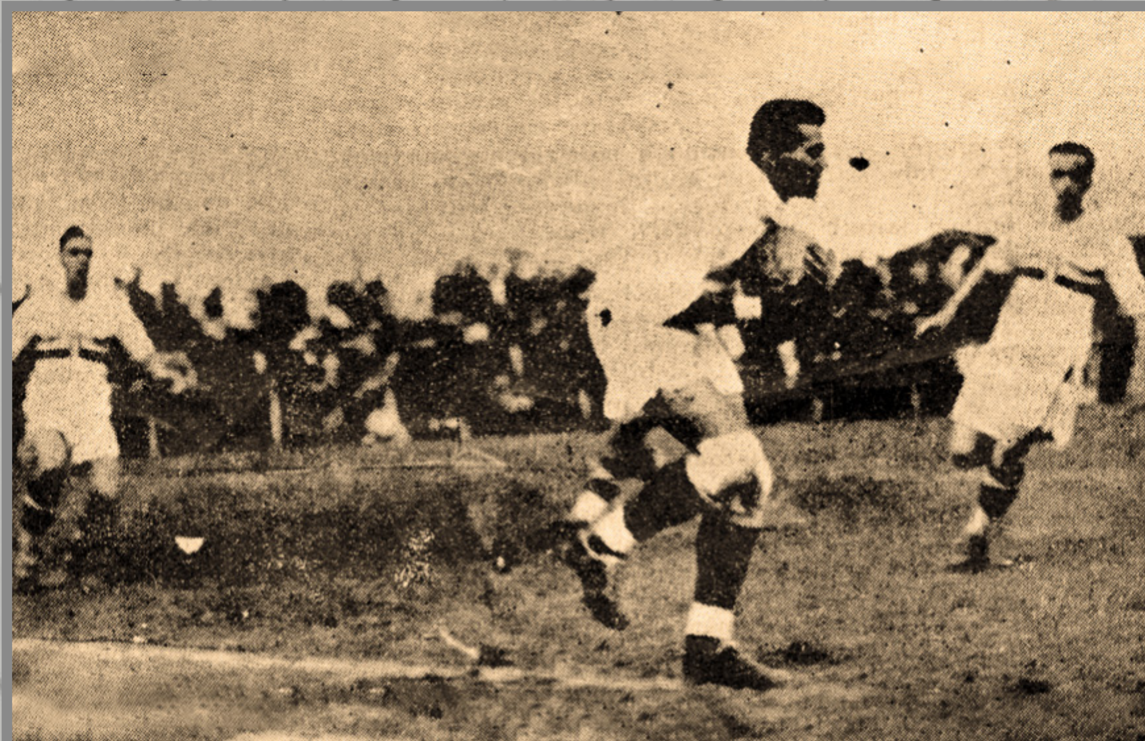
IMAGEM DE O TRICOLOR