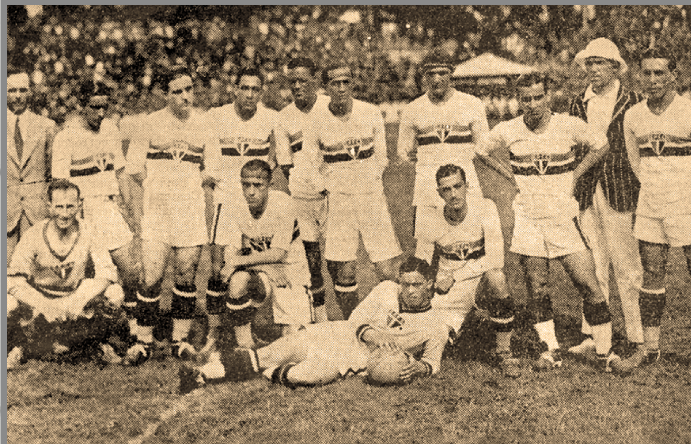
IMAGEM DE ARQUIVO HISTÓRICO

CAMPEONATO PAULISTA ESTÁDIO DA CHÁCARA DA FLORESTA 6/DEZ