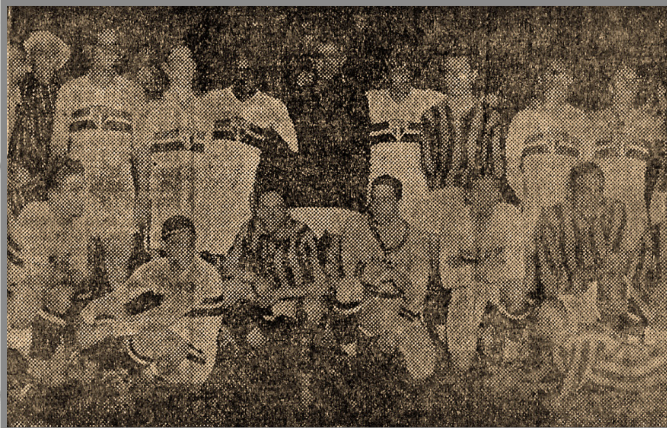
IMAGEM DE ARQUIVO HISTÓRICO

CAMPEONATO PAULISTA ESTÁDIO DA CHÁCARA DA FLORESTA 16/MAI