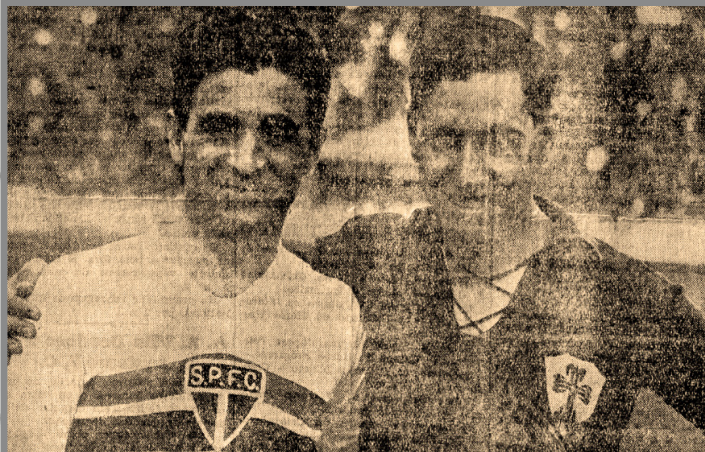
IMAGEM DE ARQUIVO HISTÓRICO

CAMPEONATO PAULISTA ESTÁDIO DA CHÁCARA DA FLORESTA 27/SET