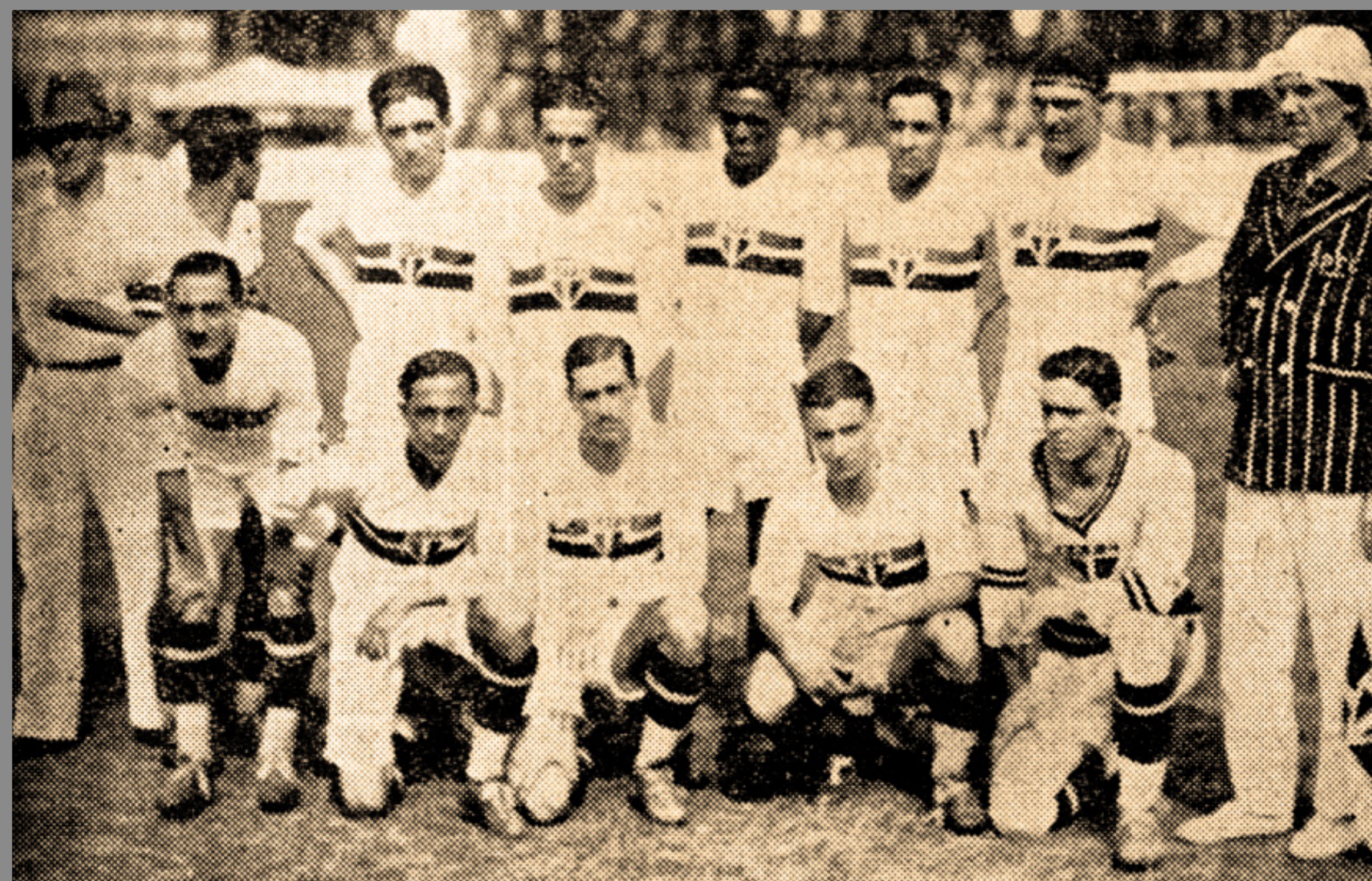
IMAGEM DE ARQUIVO HISTÓRICO

CAMPEONATO PAULISTA ESTÁDIO DA CHÁCARA DA FLORESTA 18/OUT