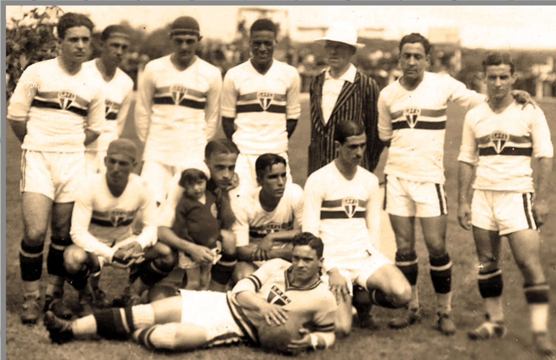
IMAGEM DE ARQUIVO HISTÓRICO