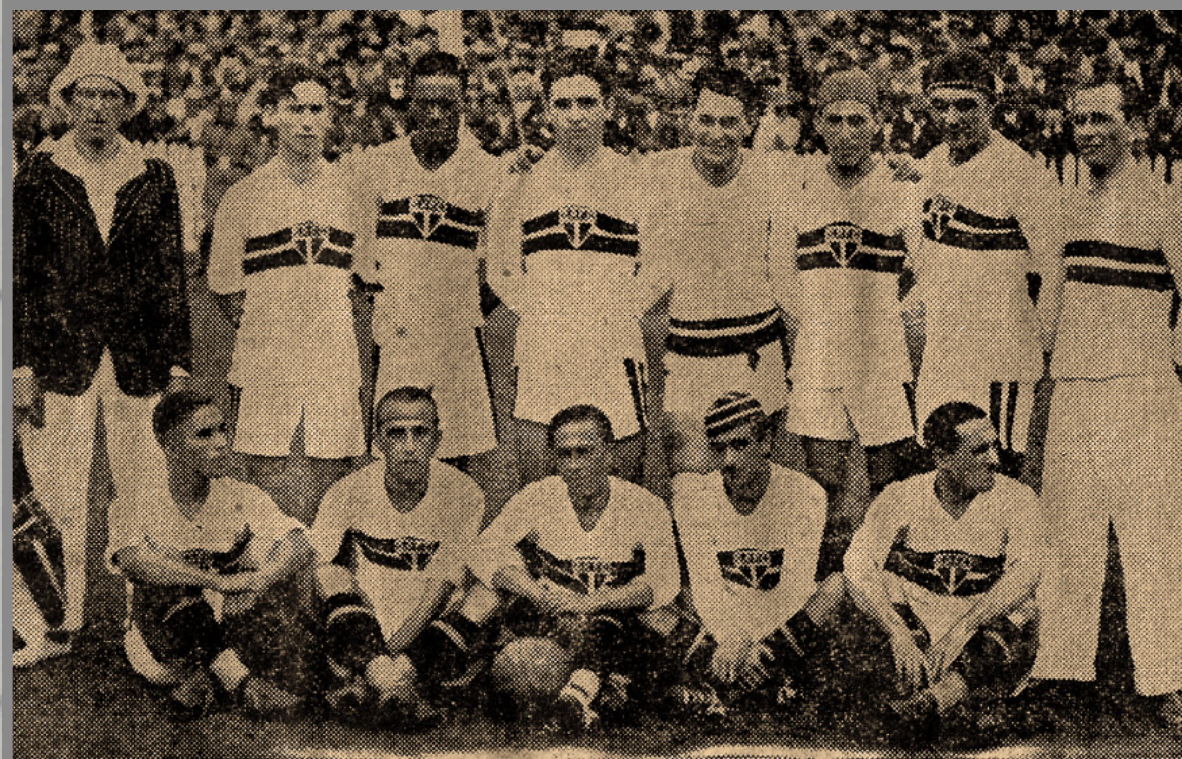
IMAGEM DE ARQUIVO HISTÓRICO

CAMPEONATO PAULISTA ESTÁDIO DA CHÁCARA DA FLORESTA 12/ABR