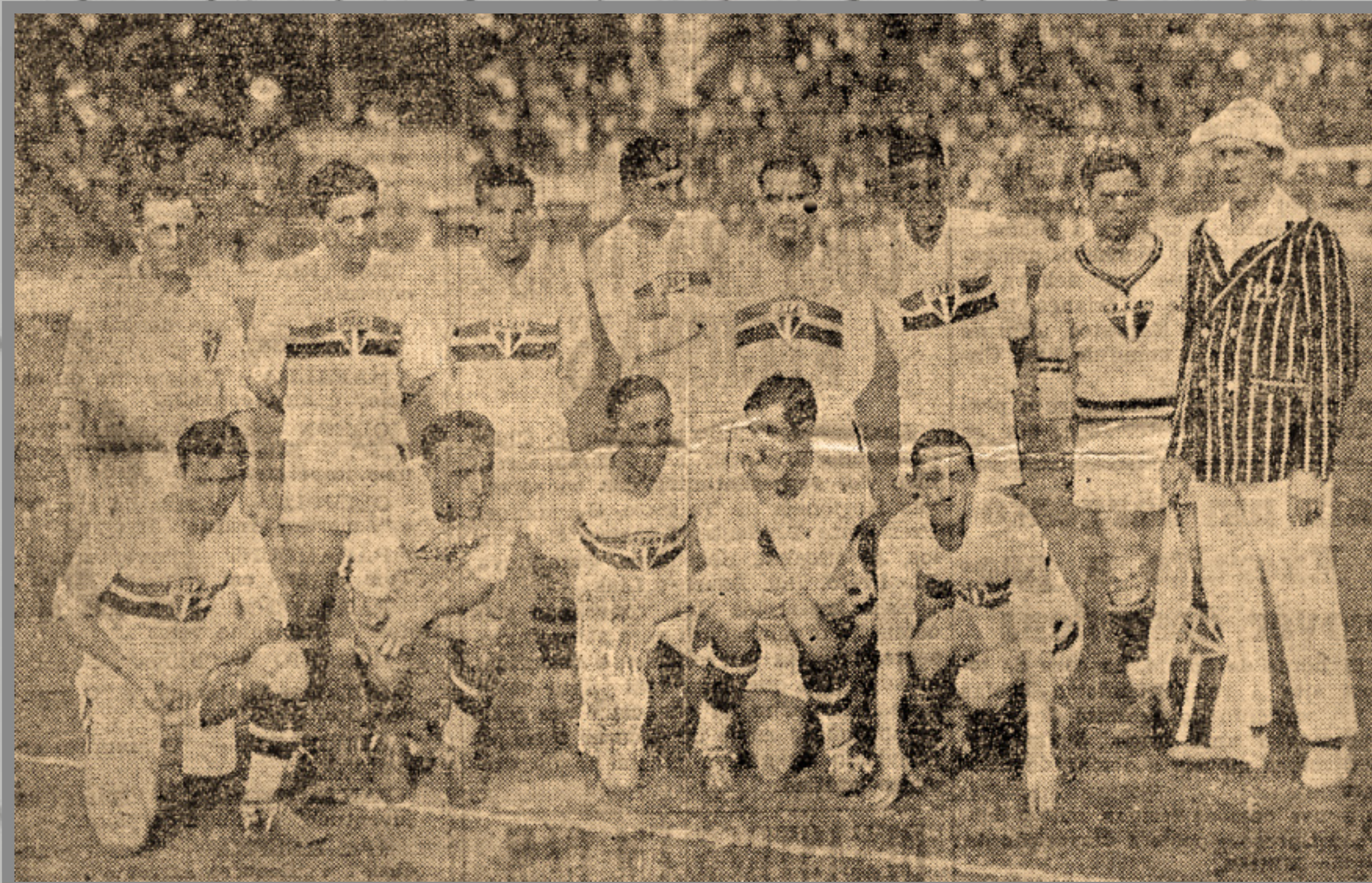
IMAGEM DE ARQUIVO HISTÓRICO

TACA GAL. ISIDORO LOPES ESTÁDIO DA CHÁCARA DA FLORESTA 6/SET