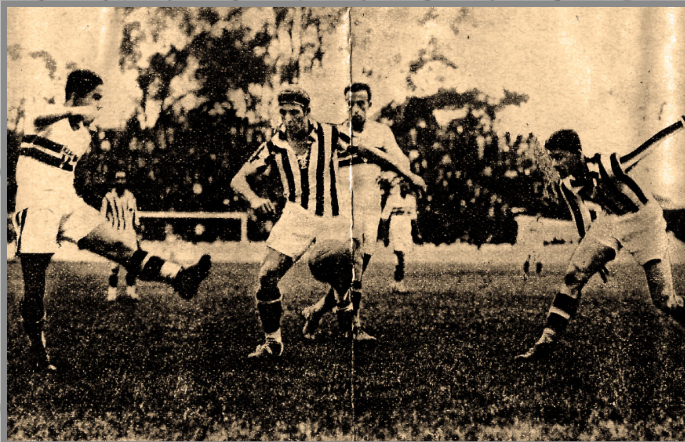
IMAGEM DE ARQUIVO HISTÓRICO

CAMPEONATO PAULISTA ESTÁDIO DA CHÁCARA DA FLORESTA 20/SET