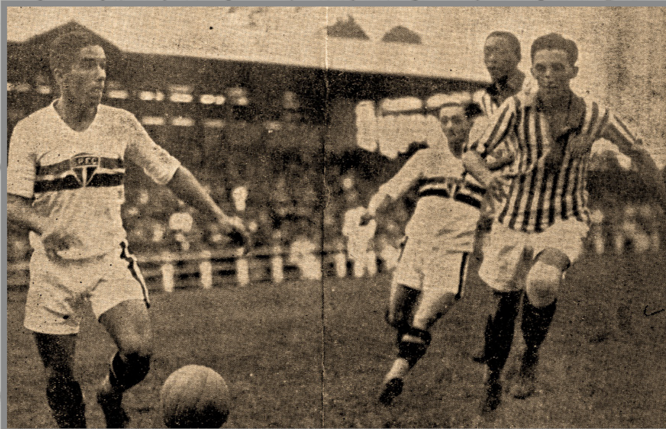
IMAGEM DE ARQUIVO HISTÓRICO

CAMPEONATO PAULISTA ESTÁDIO DA CHÁCARA DA FLORESTA 8/NOV