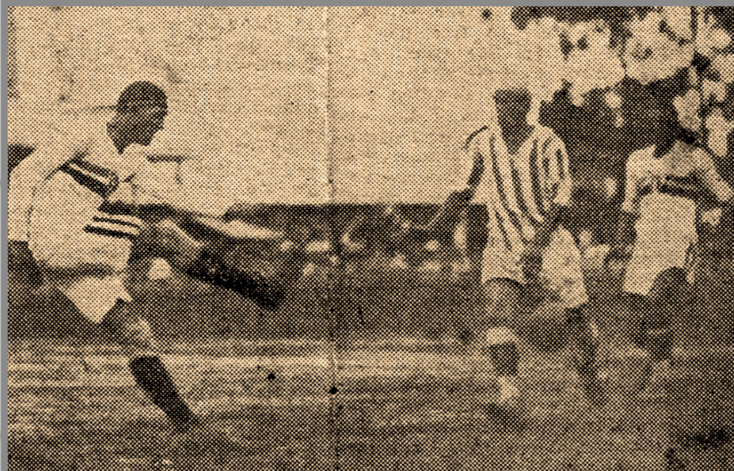
IMAGEM DE ARQUIVO HISTÓRICO