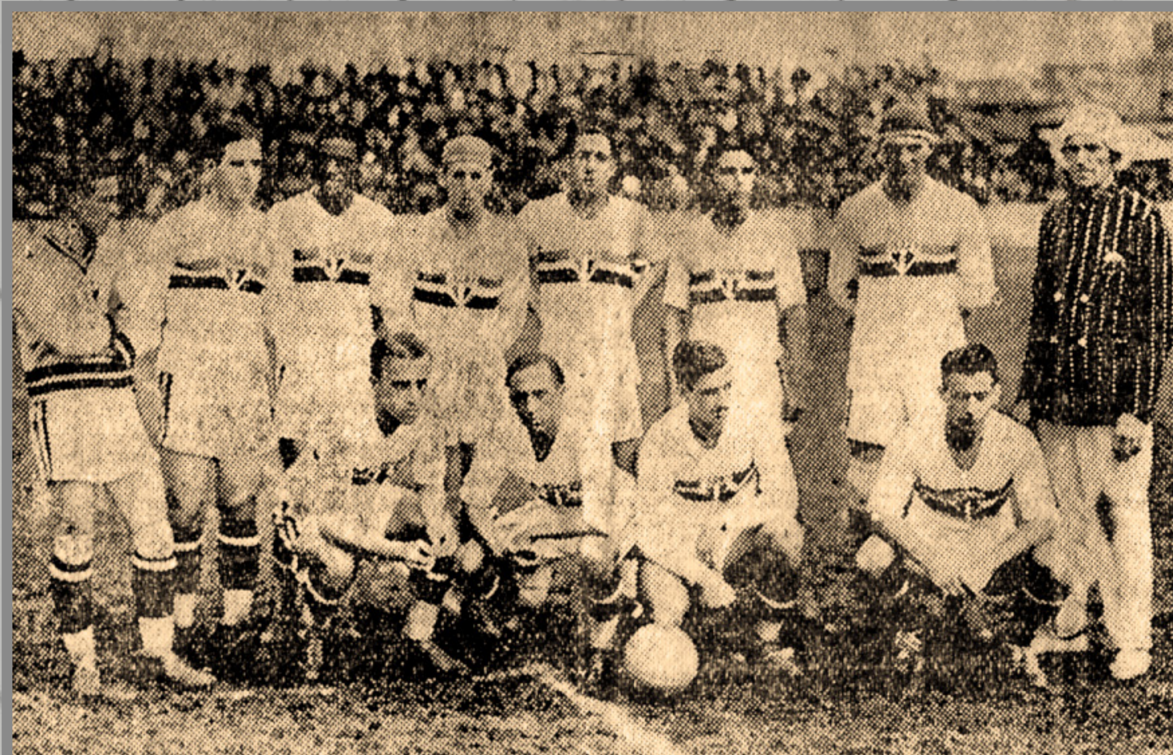
IMAGEM DE ARQUIVO HISTÓRICO