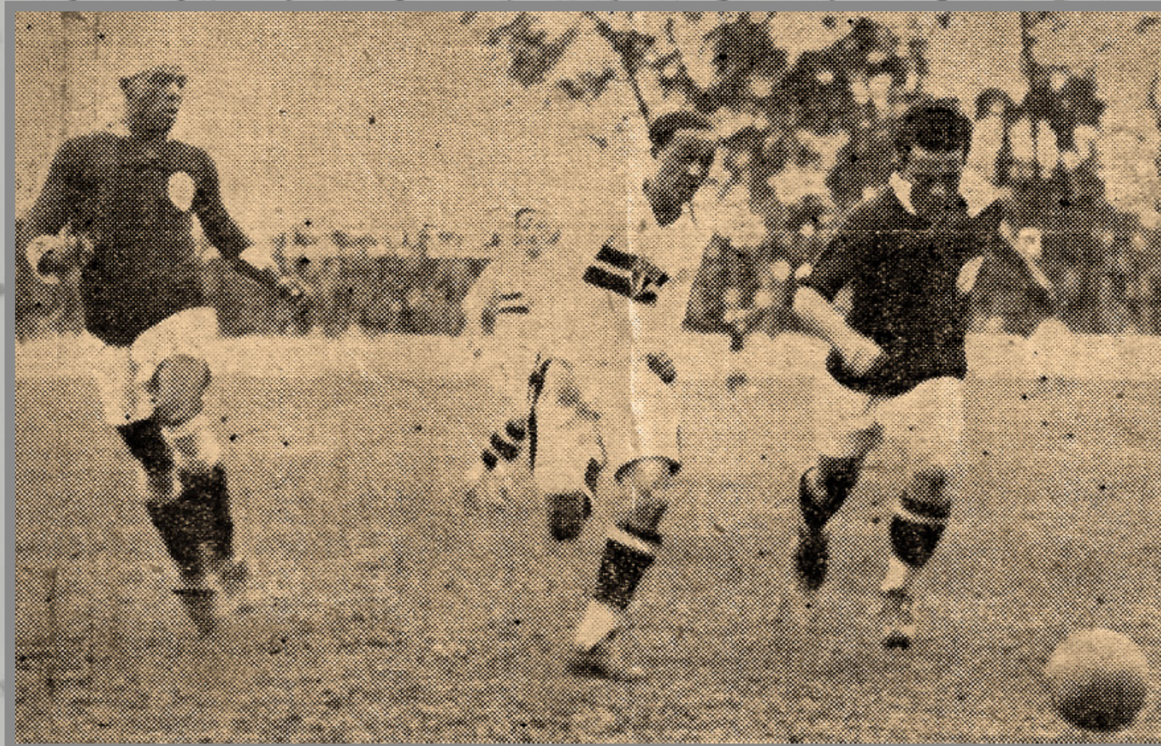
IMAGEM DE ARQUIVO HISTÓRICO

CAMPEONATO PAULISTA ESTÁDIO DA CHÁCARA DA FLORESTA 10/MAI