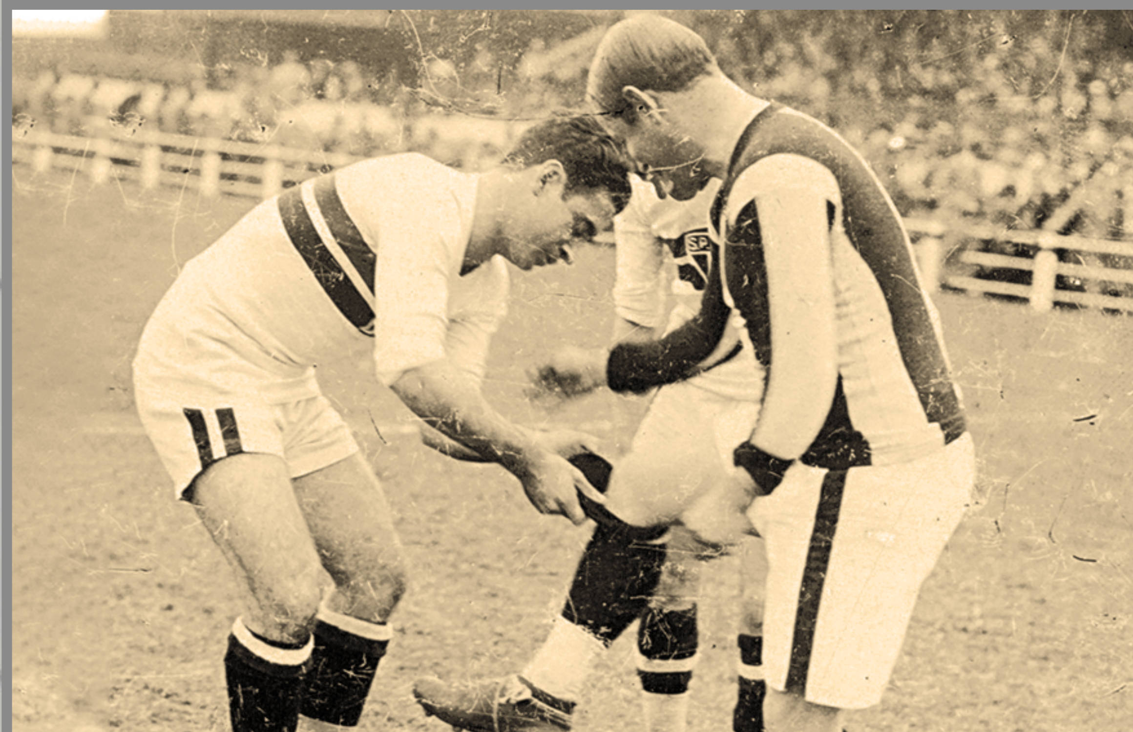
IMAGEM DE ARQUIVO HISTÓRICO

CAMPEONATO PAULISTA ESTÁDIO DA CHÁCARA DA FLORESTA 7/JUN