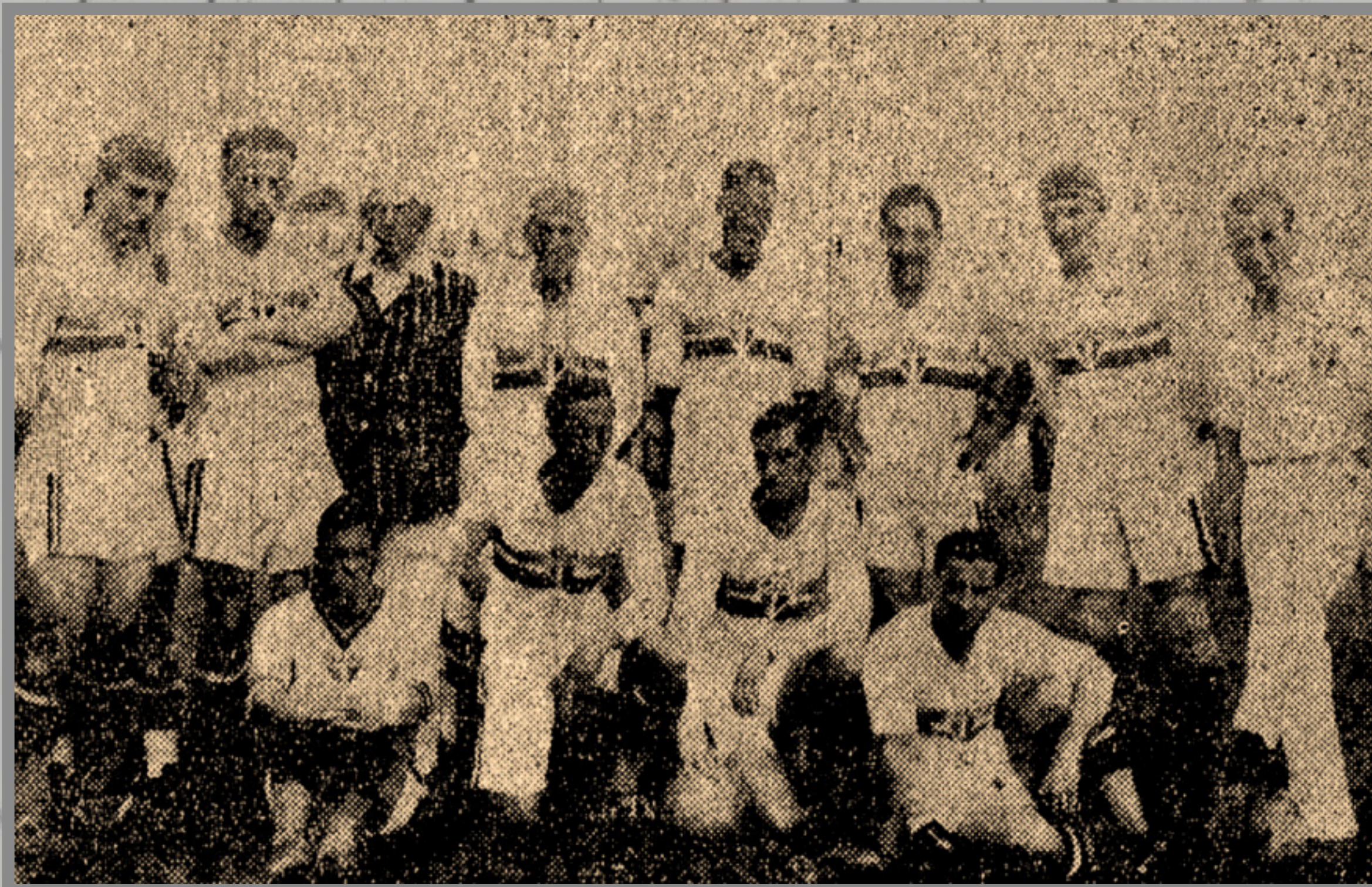
IMAGEM DE ARQUIVO HISTÓRICO

CAMPEONATO PAULISTA ESTÁDIO DA AV. CONSELHEIRO NÉBIAS 29/NOV