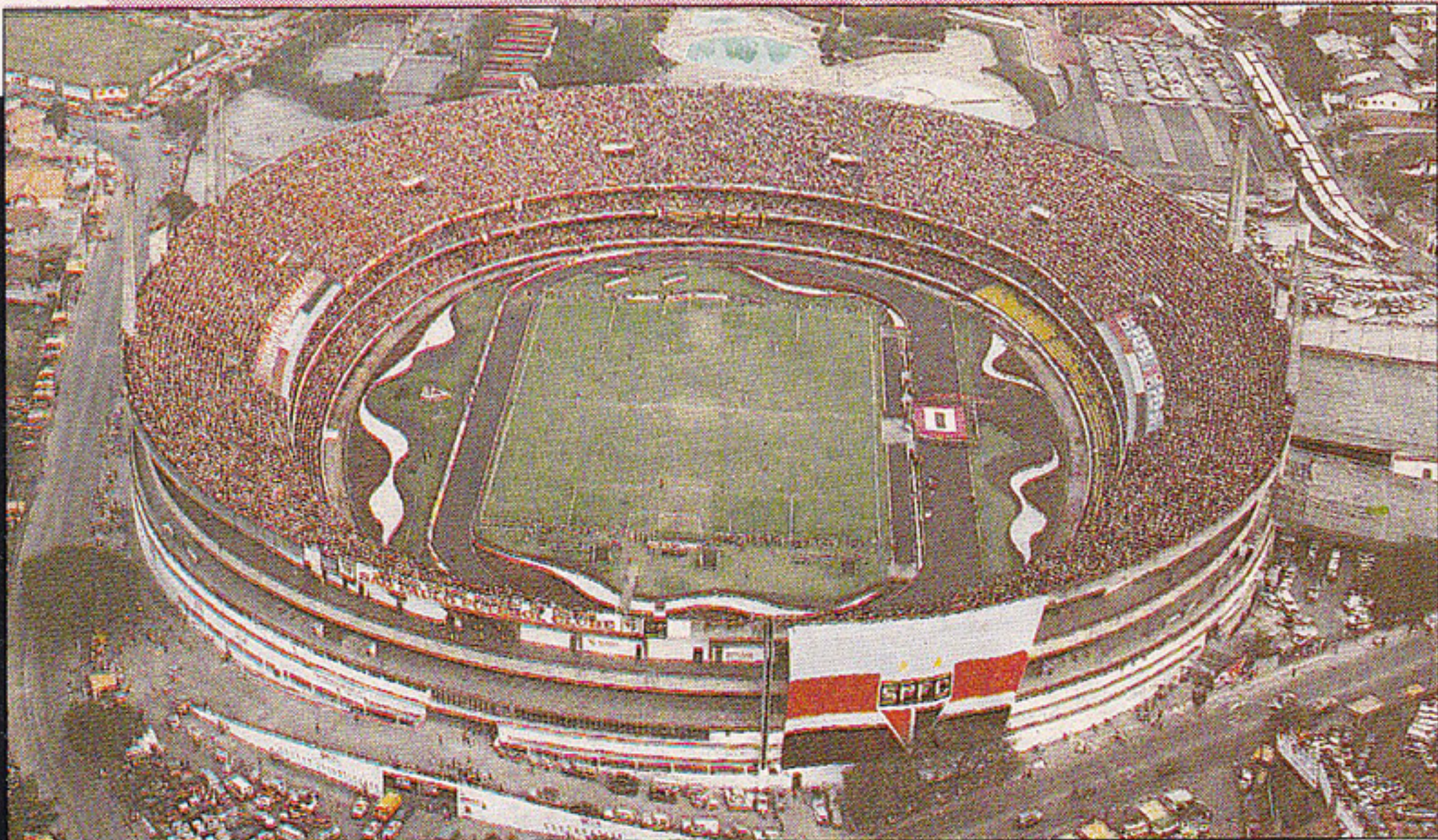
Estádio Cícero Pompeu de Toledo - Morumbi